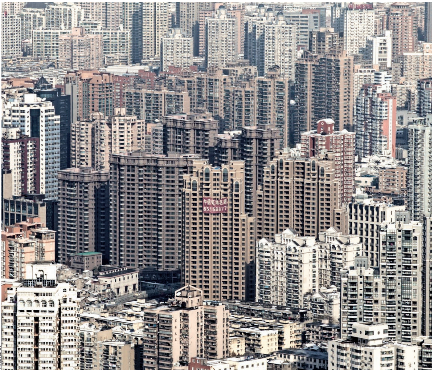
Panoràmica del barri de Hongkou, un de tants de Xangai on l'arquitectura tradicional ha estat substituïda pel creixement vertical.

les circumstàncies –del comunisme radical es pot passar a un capitalisme oportunista–, però el seu poder absolut és innegociable i la democràcia entesa a la manera occidental és un tabú.