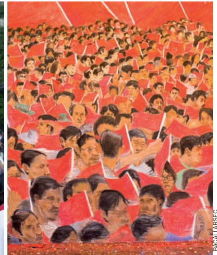
Un carrer cèntric i comercial de Xangai, atapeït de gent i de banderes xineses. A la dreta, mural que recorda la revolució, amb restes de confeti escampades per terra.

dament), segons dades del govern. Els jornals del sector públic són prou més elevats: 37.140 iuans (més de 3.100 euros) de mitjana. Però és molt habitual de trobar treballadors que no passen de 1.500 iuans mensuals (150 euros).