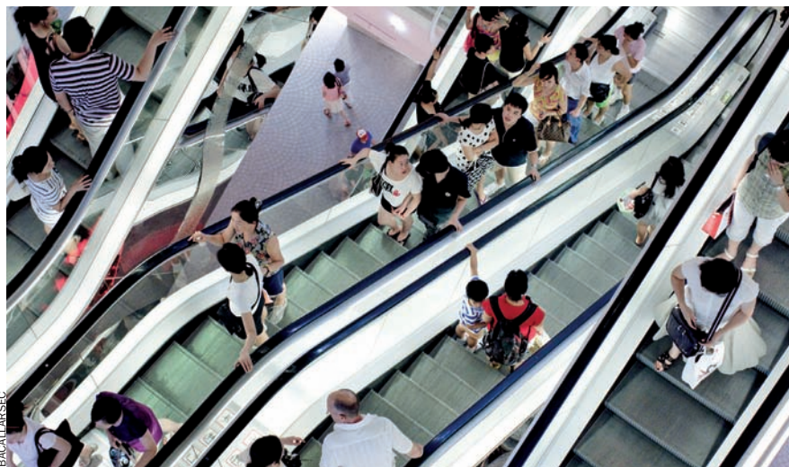
Panoràmica de les escales mecàniques de Metrocity, una de les àrees amb més concentració de centres comercials especialitzats en electrònica de Xangai.

Lloc sagrat de la revolució (també econòmica). Xangai és considerat un dels sis llocs sagrats de la revolució. La revolució política, s'entén. A més, l'any 2011 Xangai és també de segur un dels primers llocs sagrats –si no el primer– de la revolució econò-