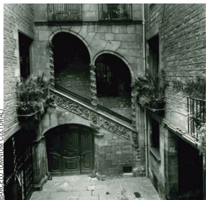
La primera seu d'Òmnium Cultural va ser al Palau Dalmases del carrer de Montcada de Barcelona.

Nova Cançó, del premi Carles Riba i de la Fundació Enciclopèdia Catalana.