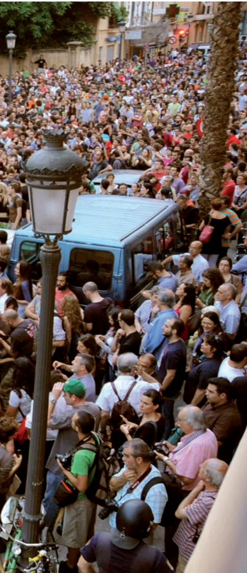
Concentració davant la comissaria de Sapsadors de València, on es va reclamar l'alliberament dels detinguts el 2 de juny, durant les protestes dels indignats davant les Corts.

d'estudiar en el seu idioma, com ho també van fer ells.