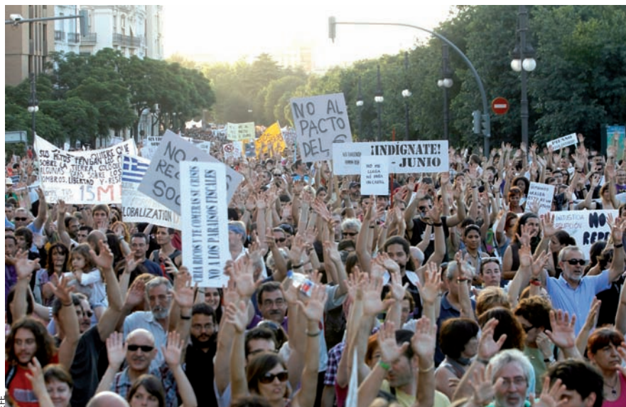
Manifestació dels indignats el passat 19 de juliol a València