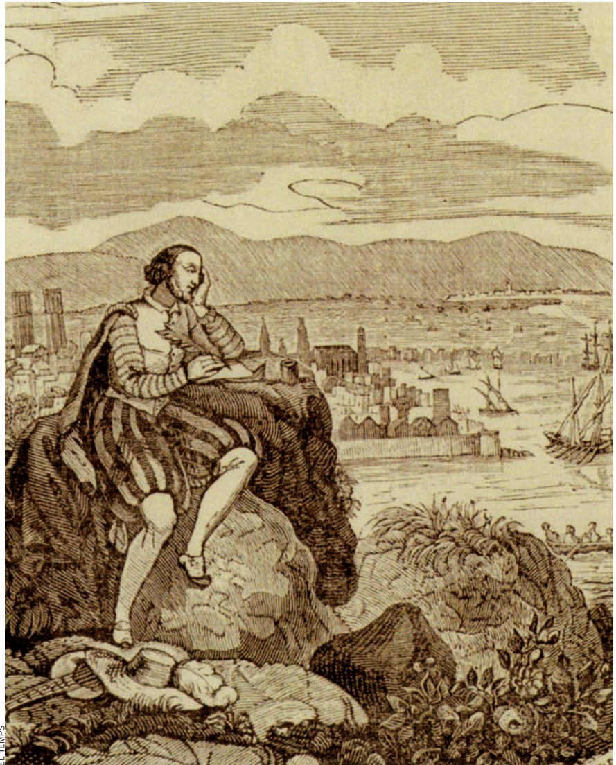
Xilografia que il·lustra una edició de l'obra de Pere Serafi, escriptor del XVI. Reprodueix una imatge romàntica del poeta. És una de les imatges del llibre Llengua i literatura. Barcelona 1700 .

L'edició del llibre, que forma part de la sèrie “La ciutat del Born. Barcelona 1700”, coincideix amb l'aparició d'un altre volum, també col·lectiu, destinat a constatar la força de la literatura catalana d'aquests tres segles, Del Cinccents al Setcents. Tres-cents anys de literatura catalana , publicat per Edicions Vitel·la a cura d'Eulàlia Miralles.