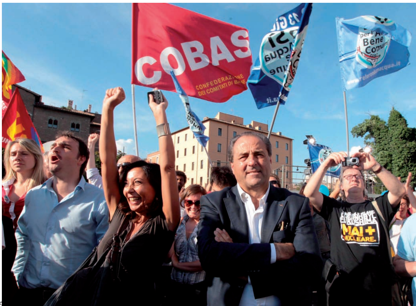
El líder del partit opositor Itàlia dels Valors, Antonio Di Pietro, celebra el resultat dels referèndums, a Roma, el dia 13 de juny passat.