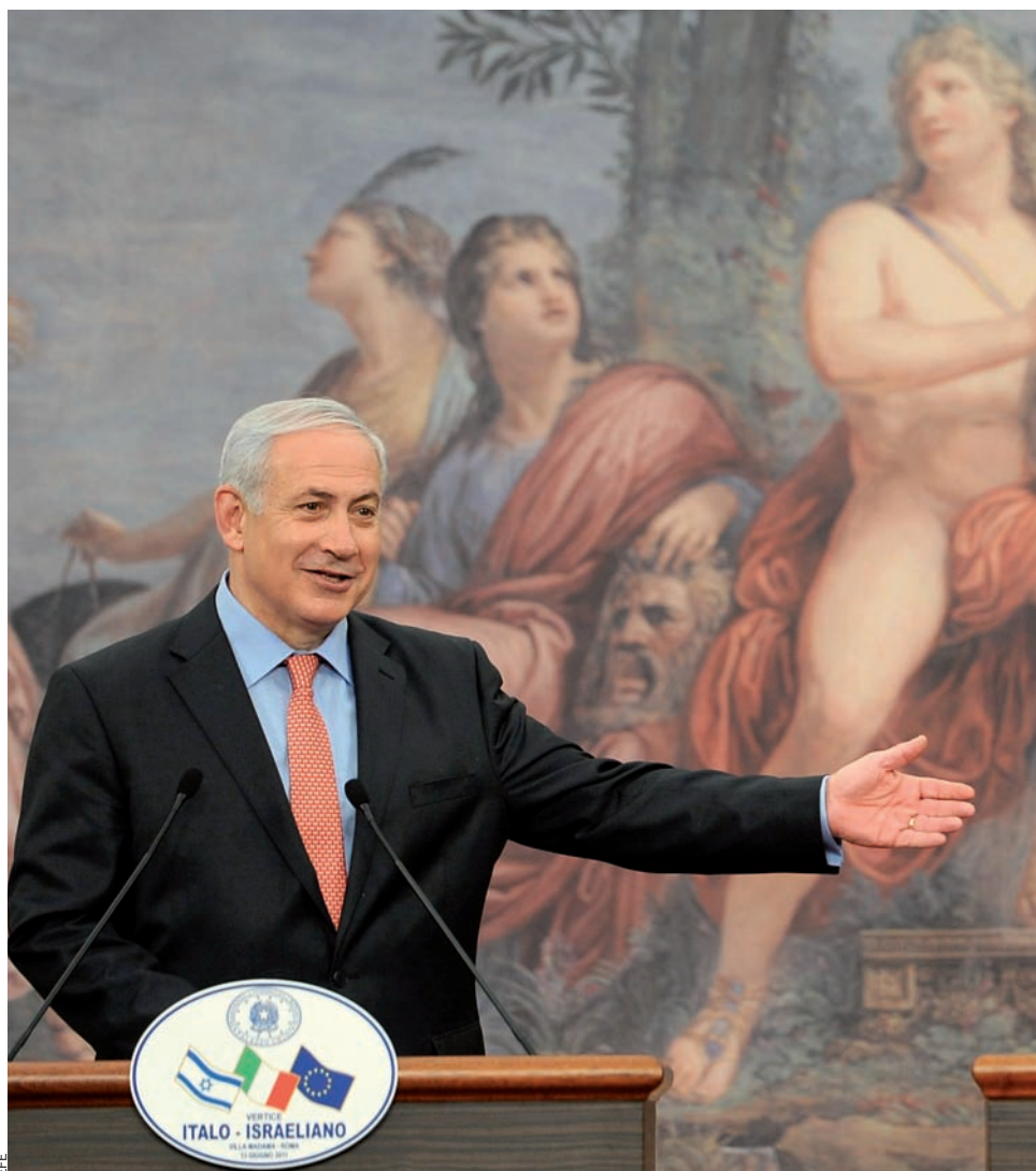
El president del govern italià, Silvio Berlusconi, i el seu homòleg israelià, Benjamin Netanyahu, durant una conferència de premsa, a Villa Madama, a Roma, el 13 de juny passat, dia de la segona jornada del referèndum. Aquesta aparició va ser recollida per la premsa perquè Berlusconi va fer un acudit amb relació a la seva vida privada. Davant les divinitats mig nues del quadre d'Andrea

En general, els professors italians consultats opinen que l'oposició a