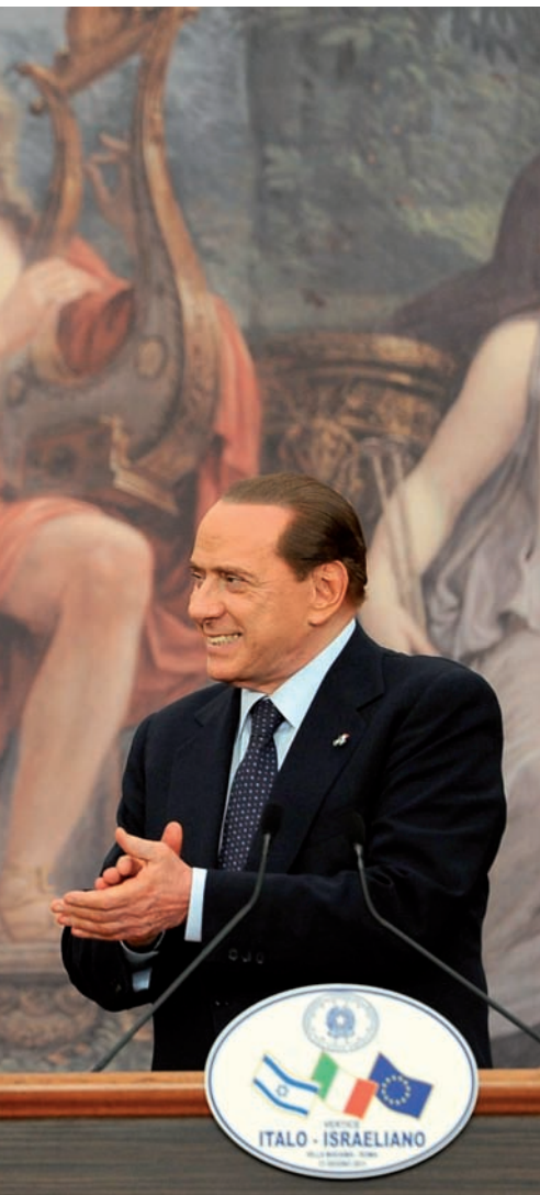
Appiani que representa el Parnàs, Berlusconi va dir que es tractava del “bunga-bunga del 1811”.

allunyament de la vida real encara pitjor que aquí. A Itàlia la gent ja fa molts anys que està indignada, però no deixa de ser una part relativa de la