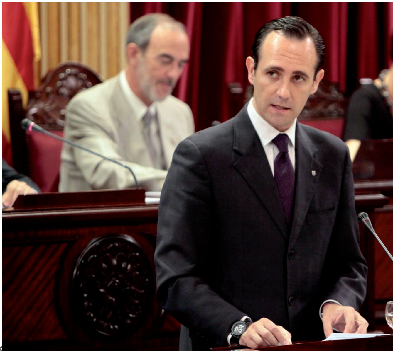
José Ramón Bauzà, nou president del Govern de les Illes Balears, durant el discurs d'investidura al Parlament, la setmana passada.

J osé Ramón Bauzà ja és el president del Govern de les Illes Balears. El canvi s'ha fet realitat. Què canviarà exactament d'ara endavant? Doncs d'entrada l'estructura del govern ha mutat radicalment. A més, els canvis poden ser també molt importants en tres eixos cabdals de l'acció de govern: llengua, turisme i urbanisme.