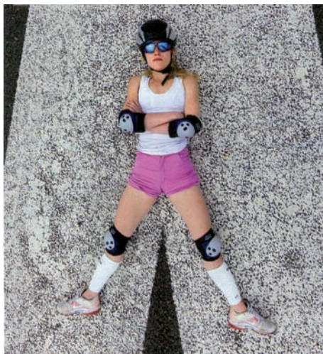
Klaus Wowereit, batlle de Berlín, confia que els artistes donen un impuls especial a la ciutat. A la dreta, la sueca Helga Wretman, de 25 anys, una de les participants més joves de la mostra.

que semblen pintures abstractes, i possiblement això salva la seua reputació en un món de l'art que des de fa molts anys afavoreix una estètica més aviat seca.