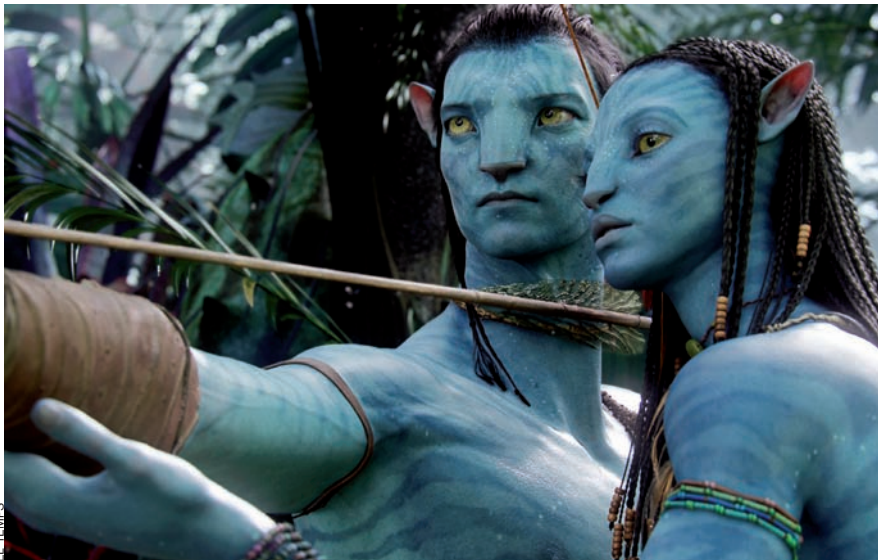
“Cinema i Televisió en 3D” és un curs de l'Institut d'Educació Continuada (IDEC) de la Universitat Pompeu Fabra. Estudiarà les possibilitats del sistema que es va fer servir a Avatar (foto).

que es consolida com a alternativa als sistemes operatius de llicència privada. L'objectiu principal del curs és donar uns coneixements bàsics de caràcter eminentment pràctic que permeten la instal·lació, l'administració i la utilització d'aquest programari.