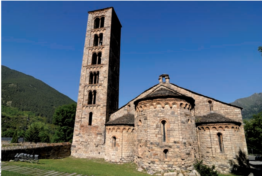
Fa deu anys que el romànic de la vall de Boí va ser declarat patrimoni mundial de la UNESCO (a la foto, Sant Climent de Taüll). Les conseqüències, a debat en un curs de la Universitat de Lleida.

La tradició clàssica indica que l'heroi, en el seu trajecte vital, ha de viatjar al món dels morts per a donar un ple sentit a la seua vida. Seguirà els passos d'aquesta experiència de la mort transversalment (mitjançant la literatura, la música, l'art i el cinema), a través de l' Odissea i l' Eneida , de l'heroi Orfeu i de la Divina Comèdia de Dante fins als nostres dies ( Vertigen de Hitchcock).