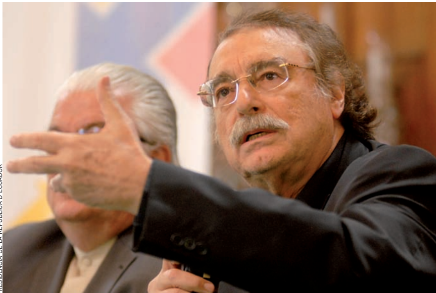
PRESIDÈNCIA DE LA REPÚBLICA D'ECUADOR

Aquest curs mostra com articular el recurs de la mediació intercultural com a eina complementària als instruments