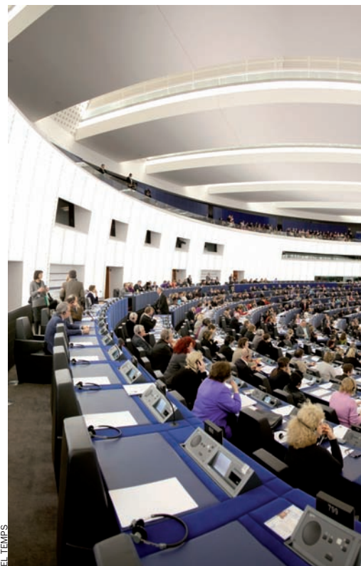
Vista panoràmica de l'hemicicle del Parlament

E l Partit Nacional Escocès (SNP), que governa amb majoria absoluta, considera que si el referèndum per a la independència que vol organitzar prospera i Escòcia esdevé un nou estat, forçosament haurà de continuar formant part de la Unió Europea (UE). El principal argument del primer ministre Alex Salmond, en aquest sentit, és que Escòcia, en tant que part del Regne Unit, és ara per ara membre de ple dret de la Unió Europea i ho continuaria essent encara que trenqués els lligams amb Anglaterra. “Hi estic totalment d'acord. Jurídicament és així. És una fal·làcia que, permetent la redefinició d'un territori que ja forma part de la UE, en quedaria fora. No hi ha cap impediment a la UE perquè Escòcia en continuï formant part si se separa del Regne Unit. Totes dues parts tenen dret per defecte a quedar-se i no és cert que hagin de tornar a demanar l'ingrés”, assegura Raül Romeva, diputat d'ICV al Parlament d'Estrasburg.