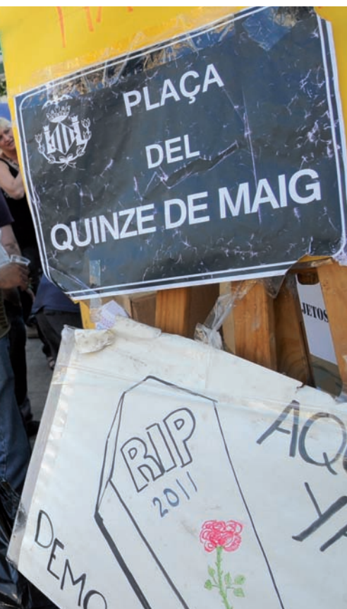
que generalitzen la crítica a la política.

un responsable polític. O és igual un regidor que fa anys que perd els diners i la salut pel seu poble que un gran banquer?”