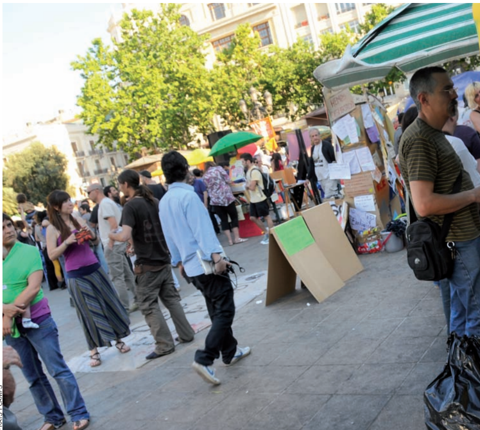
La majoria dels polítics troba comprensible la indignació dels acampats, però, en general, els dol

A Alorda, però, el neguiteja més que la crítica contra el sistema s'estenga perillósament contra el sistema democràtic en si mateix: "Allò que ens sona malament són les consignes que criden contra el sistema i l'igualen a la democràcia; mai no serem allà on es crida contra la democràcia."