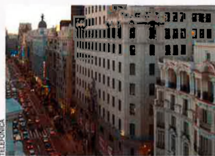
Seu de Telefónica.

En vista de l'allargament de l'edat de jubilació aprovada a principi d'any, el Ministeri de Treball espanyol pressiona la multinacional de telefonia per tal