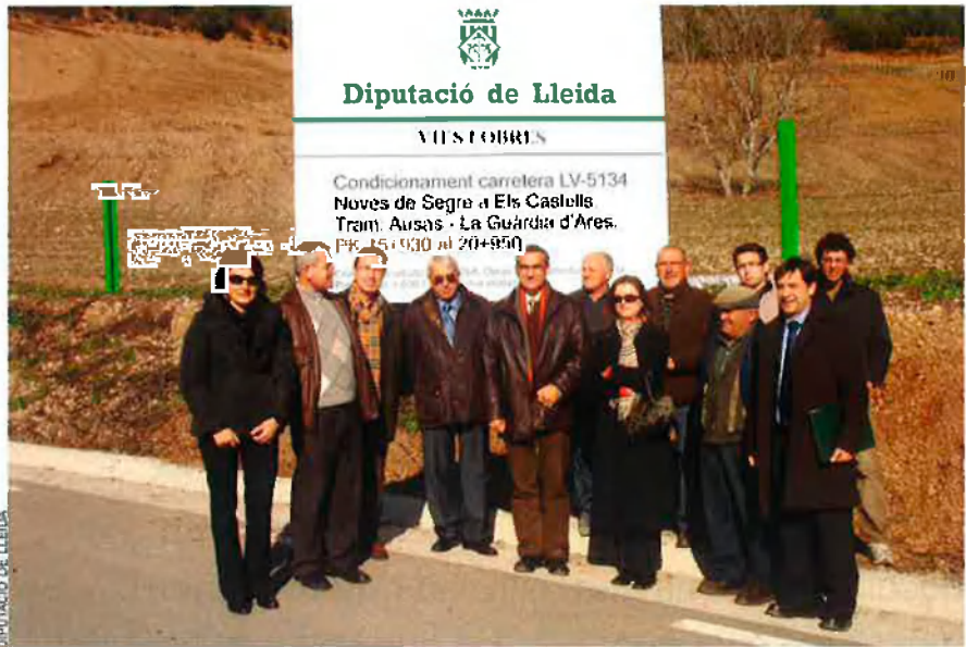
Les funcions de les diputacions són força difuses, però entre les més conegudes hi ha l'arranjament de carreteres, la xarxa de biblioteques i la gestió dels parcs naturals.

És el cas d'ERC a Barcelona, que, tot i tenir alcaldies i molts regidors als partits judicials que integren la Diputació, només obté 2 dels 51 diputats provincials. Això mateix li passa a ICV i, en menor mesura, al PP. Perquè s'atorguen X diputats a cada partit judicial, que s'adjudiquen al partit més votat. I si n'hi ha més d'un, al segon. A tall d'exemple, ERC té molta força al Berguedà, però com que en aquest