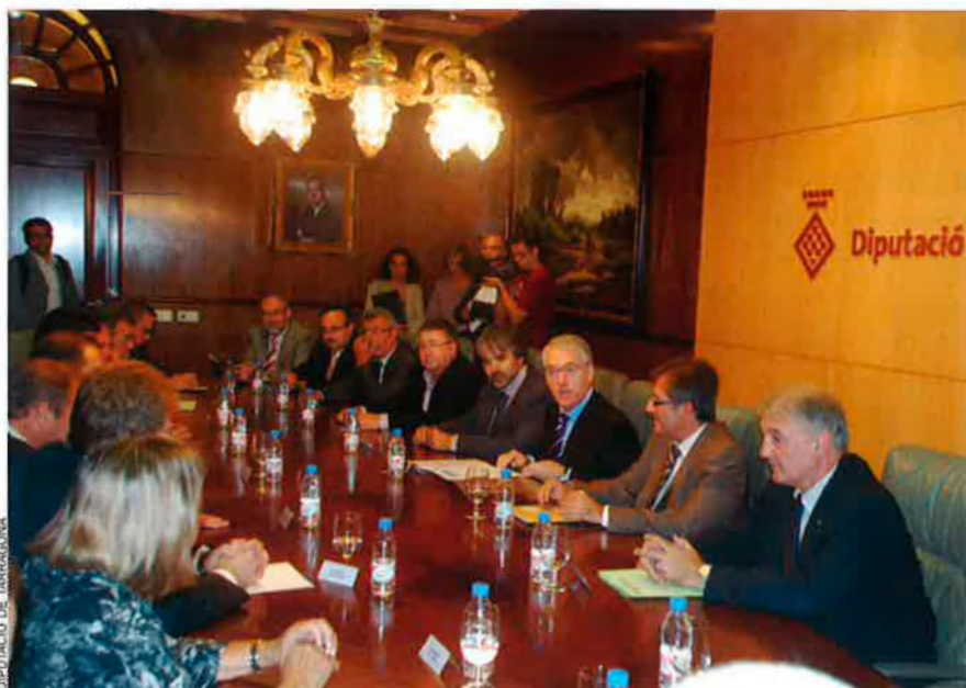
El ple de la Diputació de Girona, integrada per 27 diputats provincials, aprovava el desembre del 2010 el pressupost per a enguany, 127 milions d'euros, un 10% menys que el 2009.

A la caixa d'aquesta diputació hi ha pressupostats per al 2011 615 milions d'euros, que es destinen a donar servei a tots els ajuntaments integrats en l'ens en matèria d'infraestructures, equipaments culturals, serveis socials, parcs naturals, gestions d'impostos, etc. Però també –cosa molt important per als partits– a pagar els generosos sous del president, 9.184,2 euros bruts mensuals; dels vice-presidents, membres de l'executiva i presidents dels grups, que pugen a 6.921 euros bruts mensuals; 6.301,75 euros per als diputats adjunts a la presidència; 5.967 euros per als diputats delegats d'àrea, diputats delegats, diputats adjunts i diputats portaveus dels grups. I finalment, els més humils, els diputats