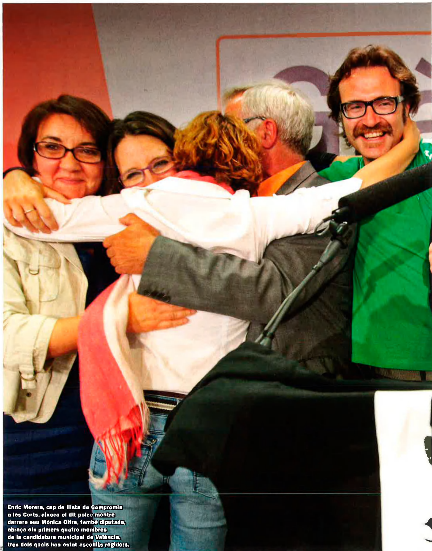
Enric Morera, cap de llista de Compromís a les Corts, aixeca el dit polze mentre darrere seu Mònica Oltra, també diputada, abraça els primers quatre membres de la candidatura municipal de València, tres dels quals han estat escollits regidors.