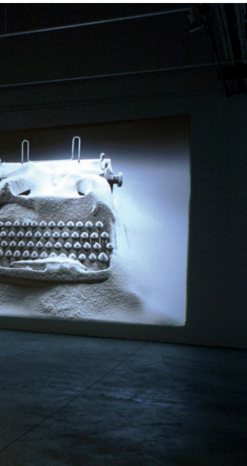
una brillantor blanca que es transmet, al seu torn, al projector.

per a no dir indistingibles. Avui, en ple segle XXI, el cinema és a tot arreu: als televisors, als ordinadors, als telèfons mòbils... Tots podem fer un film de les nostres vides. El llenguatge cinemàtic ha