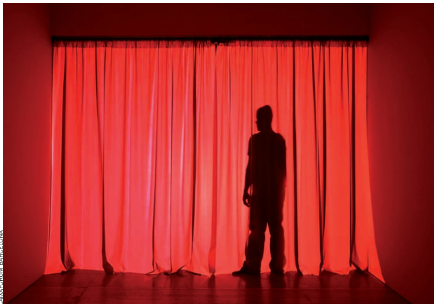
Douglas Gordon capta els espectadors que passen a l'altra banda de la cortina.

Rodney Graham (Vancouver, Canadà, 1949) es destaca per un enginy divertit, posseeix una obra extensa i variada, en què trobem arquitectura, escultura, interpretacions i composicions musicals, textos, fotografies, films i vídeos. En la peça que exhibeix a CaixaFòrum, Rheinmentall / Victoria 8 , (2003) canvia les seves bromes habituals per la confrontació poètica entre dues màquines obsoletes. Com una parella en què, mentre envellaix, cadascú es reflecteix en la imatge de l'altre, el projector d'època percep la imatge de l'element que es mostra a la pantalla: una desfasada màquina d'escriure. Mentre que aquesta es va cobrint inexplicablement de neu, la brillantor blanca que emet es transmet al seu torn al projector. Lentament, aquesta dansa silenciosa i surrealista es va assemblant als somnis de l'espectador que la contempla.