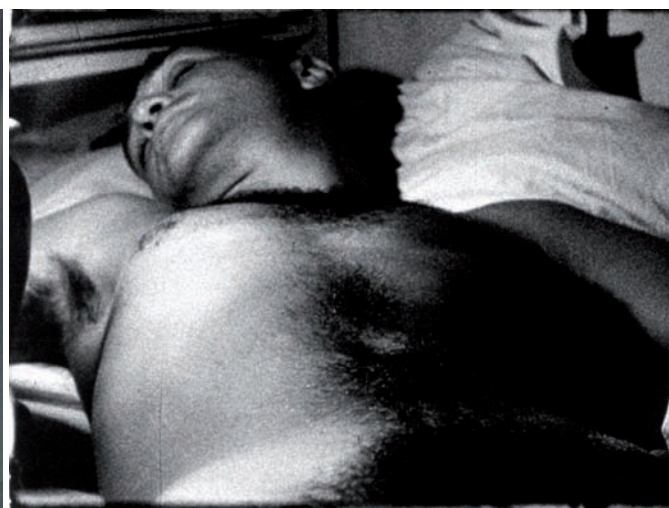
Teresa Hubbard i Alexander Birchler impedeixen que Alicia travessi l'espill. Els artistes imposen la simbòlica idea d'infinutud a través d'aquest escenari, en una filmació sense principi ni fi. L'amant d'Andy Warhol, John Giorno, en el descans nocturn. Sleep (1963) és el primer experiment filmic de Warhol.