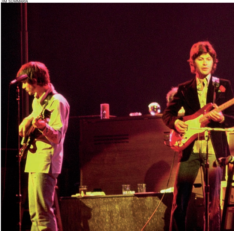
A l'esquerra, Bob Dylan devers el 1965. Al centre, Bob Dylan and The Band, en una actuació l'any 1974. A la dreta, una imatge més recent del

l'acusació de "Judes". Dylan contesta al seguidor: "No et crec. Ets un mentider", i encara un vigorosa interpretació de Like A Rolling Stone . Bob Dylan obria un nou camí al món del rock que va certificar amb la publicació del seu disc del 1966 Blonde On Blonde , en què amplia notòriament els paràmetres de la música popular vigents fins aquells moments. Els Beatles, sense anar més lluny, begueren d'aquesta influència dylaniana, i emprengueren un camí que els va conduir a la publicació, l'any 1967, del seu disc Sgt. Pepper's Lonely Hearts Club Band .