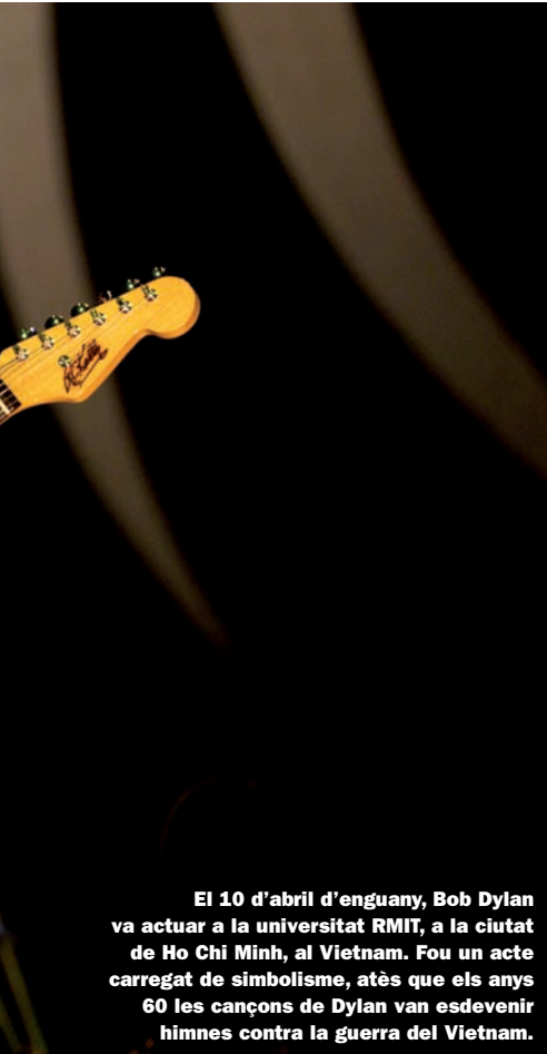
El 10 d'abril d'enguany, Bob Dylan va actuar a la universitat RMIT, a la ciutat de Ho Chi Minh, al Vietnam. Fou un acte carregat de simbolisme, atès que els anys 60 les cançons de Dylan van esdevenir himnes contra la guerra del Vietnam.

tats per a aconseguir un rosegó de pa, explicant els abusos i les desigualtats de la societat americana, en lluita incansable per un món millor. “No tinc casa, només sóc un rodamón, vaig de poble en poble, i ja no tinc casa en aquest món”, cantava Woody Guthrie. La nova fornada folk que pren el relleu són, però, més urbans i es mouen bàsicament als escenaris dels clubs de la gran capital i enregistren discos amb la voluntat d'arribar al màxim de gent possible. Bob Dylan es convertirà en l'enllaç entre les velles generacions i els joves que començaven a marcar les seves normes en el món de la música.