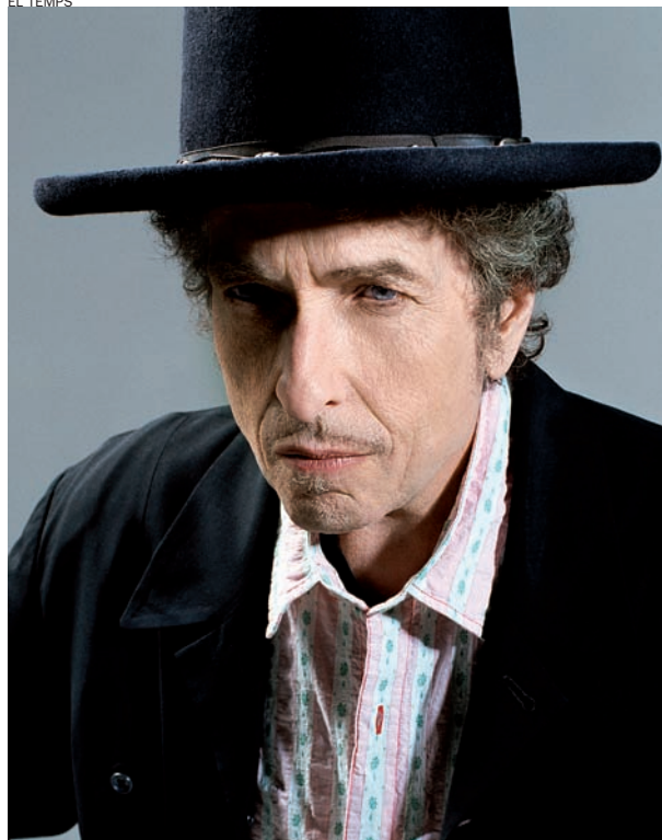
poeta del rock.

sica amb un perfil propi. D'una altra banda, el trànsit espiritual del judaisme al cristianisme, reflectit en discos com Slow Train Coming i Save , i que el portà, anys més tard, a actuar davant del sant pare a Itàlia, van marcar una certa distància amb alguns dels seus fans i van despertar unes crítiques potser un punt massa visceral contra ell.