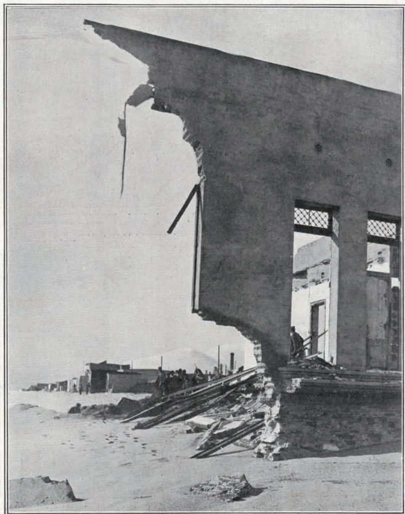
EFEKTOS DEL TEMPORAL EN BARCELONA

Estado en que quedó el edificio anejo a la iglesia de la barriada de Pekin, destruido por las olas.