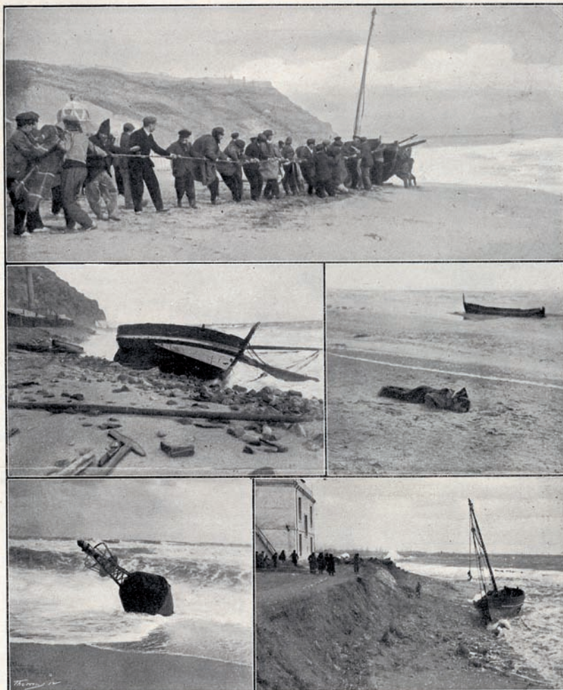
ELS VEHINS DE CA'N TUNIS SALVANT UNA DE LES BARQUES NAUFRAGADES. — BARQUES DESTROSSADES ENTRE'L ROCÀM DEL MORROT. — UN DELS NEGATS A LA SOLITARIA PLATJA DE CA'N TUNIS. — LA BOYA DE LA ENTRADA DEL PORT ARRATSTRADA PER LES ATGUES FINS A LA PLATJA. — UNA BARCA VINGUDA A TRAVÉS A LA PLATJA DE CA'N TUNIS. — (Ballell f.)

Imatges dels efectes del temporal a la zona de Can Tunis de Barcelona, que apareixen a La Il·lustració Catalana del dia 5 de febrer, cinc dies després de la primera onada.