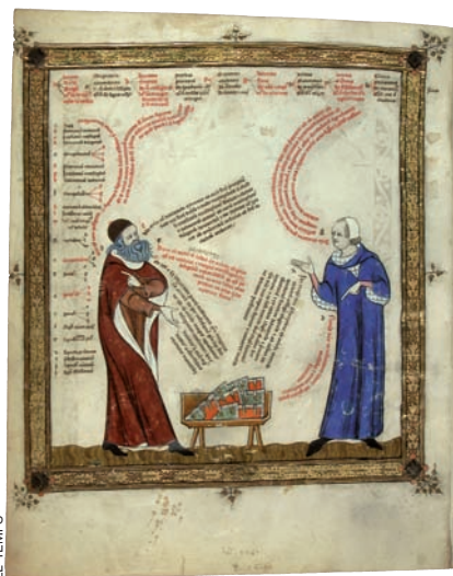
Ramon Llull va tenir influència sobre Jaume II i en va rebre protecció.

Perquè tan bon punt va tenir notícia, el futur Pere el Gran, que el pare li escapçava part de les possessions, va protestar. Secretament, com se solia fer en aquelles circumstàncies: fent constar davant notari, diguem-ne, que acatava la decisió del pare i monarca per obligació,