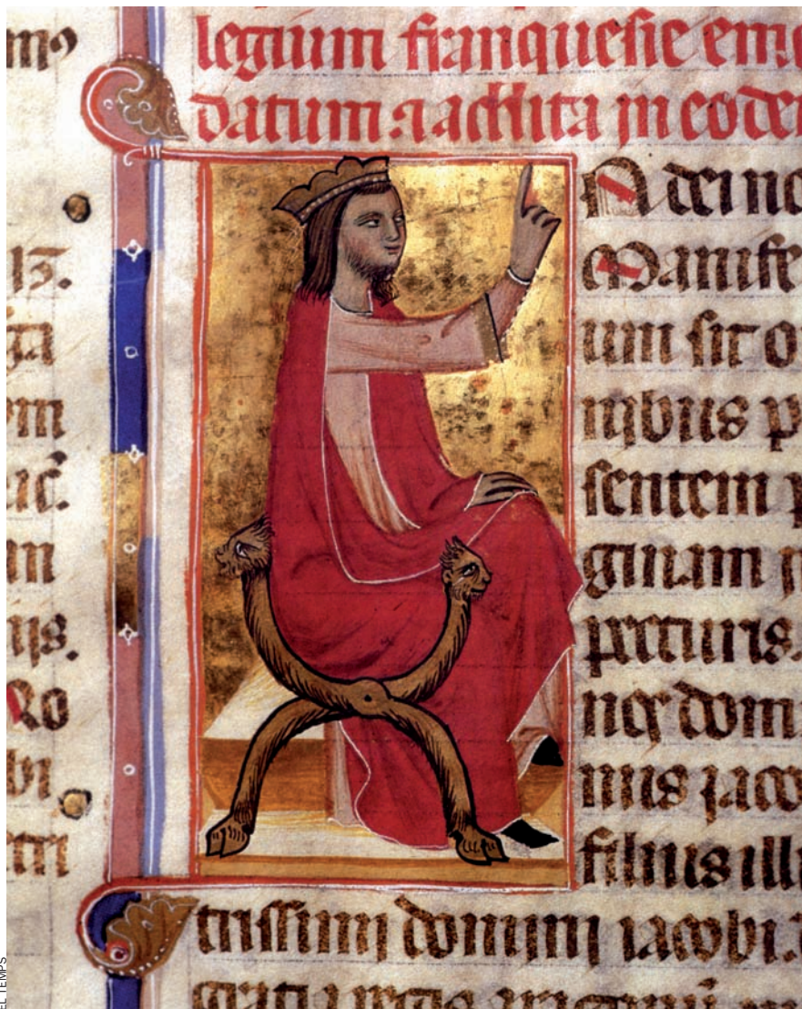
Jaume II de Mallorca (Montpeller, 1243 - Palma, 1311), segons el Llibre de les franqueses i privilegis del regne de Mallorca , del segle XIV.

Ha passat a la història com un rei basculant entre dues contradiccions: la seva figura es dibuixa entre la traïció al germà, Pere el Gran, rei de Catalunya, València i Aragó, i el tarannà tranquil de bon governant, quan ho va poder fer. El dia 29 de maig farà 700 anys exactes de la seva mort. D'aquí ve que el Consell de Mallorca hagi declarat formalment el 2011 l'Any Jaume II.