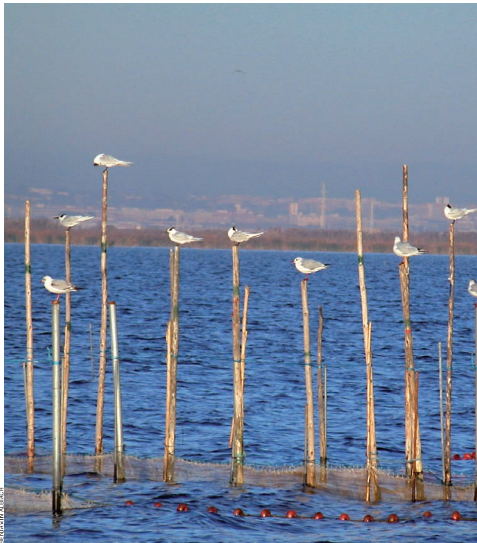
L'Albufera va ser declarada parc natural l'any 1986.