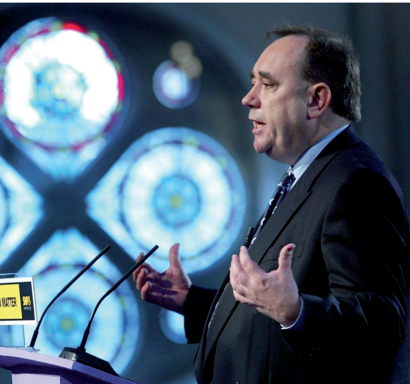
una imatge d'arxiu.