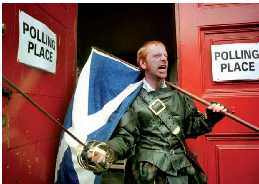
Un home disfressat surt de votar d'un col·legi electoral, a Edimburg, Escòcia, en una imatge d'arxiu.

Gray, i advertí que si Salmond guanya les eleccions el Regne Unit, tal com és ara, està condemnat a desaparèixer. “Un segon mandat li donarà autoritat moral per a proposar la independència”, va afegir el líder laborista, segons que assenyalava el diari The Scotsman . Fins ara, l'estratègia dels laboristes s'havia centrat a transmetre el missatge als electors que calia protegir Escòcia de les retallades en el pressupost que el govern britànic ha imposat des de Londres. Tanmateix, arran de la publicació de les enquestes que indiquen que l'SNP s'escapa en la intenció de vot, Iain Gray ha canviat d'estratègia i ha emprès una dura campanya d'atacs contra el projecte secessionista de Salmond. Segons els analistes, això ha estat motivat en gran mesura per les crítiques que Gray ha rebut dins el seu partit, que han posat en qüestió la manera com condueix la campanya electoral.