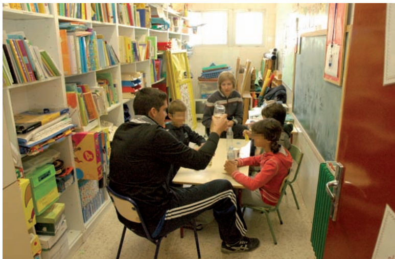
La manca d'espai al col·legi públic Lo Romero és ben evident. No sols han habitat porxos com a aules, sinó també magatzems, com en el cas de dalt. Al pati, els contenidors portuaris guarden el material esportiu i el menjador també és prefabricat. A sota, l'antiga cuina, adaptada com a aula, i la sala de professors, també polivalent.