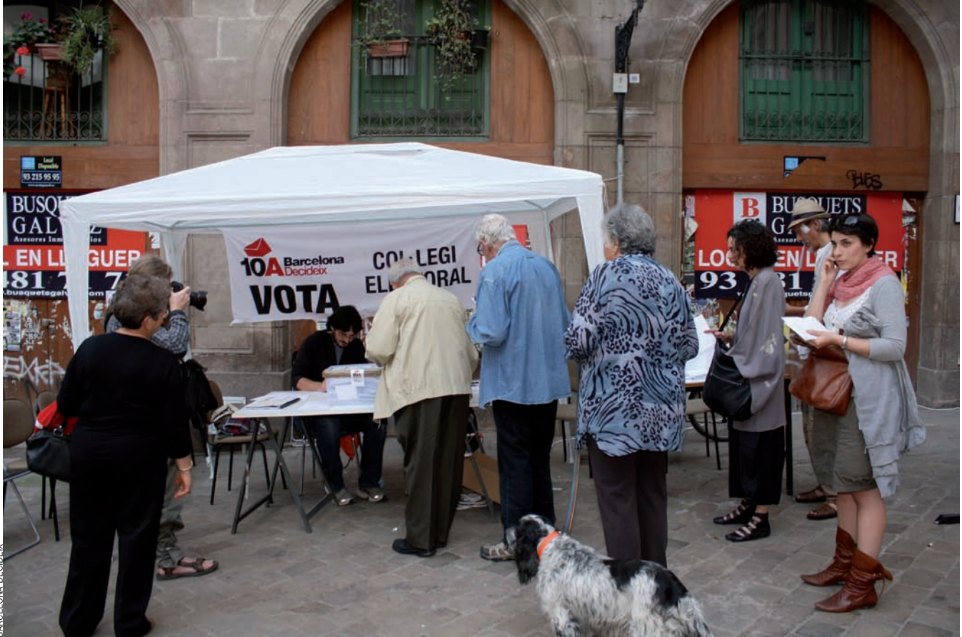
Des d'Arenys de Munt (12 de setembre del 2009) han votat sobre la independència 881.564 catalans.

Les consultes sobre la independència que van començar a Arenys de Munt l'11 de setembre del 2009 han tingut lloc a 554 municipis i han obtingut un percentatge de participació global del 18,8%, després d'haver-hi votat 881.564 persones. A Barcelona, l'última de les ciutats convocades, la participació ha estat del 18,14% (257.645 votants).