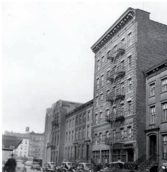
La ciutat egípcia d'Alexandria és protagonista del llibre autobiogràfic del novel·lista André Aciman –primer, a sota–, publicat en anglès el 1994. El Greenwich Village de Nova York, dels 40 i 50, és un dels personatges del llibre pòstum d'Anatole Broyard, del 1993.