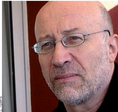
El llibre testimonial de l’historiador Tony Judt, pòstum, és El refugi de la memòria .