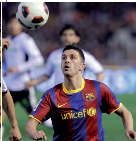
A l'esquerra, Ronaldinho i Eto'o celebren un gol al camp de Mestalla, la temporada 2004-2005. El Barça, que va guanyar per 0 a 2, va ser ovacionat aquell dia pels aficionats xes. Al centre i a la dreta, David Villa: el seu recent traspàs al Barça es va viure amb naturalitat.

“en decreïxer la radicalitat política, que de fet se circumscriu al cap i casal i a l'àrea metropolitana, perquè a Castelló, Alcoi o Alacant sempre hi ha hagut més passió pel Barça que no pel València”. La corda tibada es destesará del tot per causes estrictament futbolístiques: “La gent gaudeix amb el Barça, i no sols per la manera com juga, sinó per la manera com se'l guanya, amb remuntades increïbles i partits èpics de Claudio López, el Piojo: el Barcelona fins i tot serà eliminat pel València a les semifinals de la Lliga de Campions del 2000, una fita tan mítica com la final de la Copa del 1954 o la de Fires del 1962. La història del València amb el Barça és farcida de partits decisius molt gratificants”.