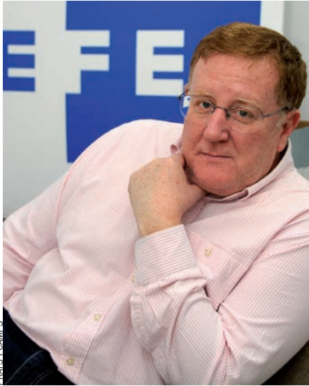
PRATS I CAMPS