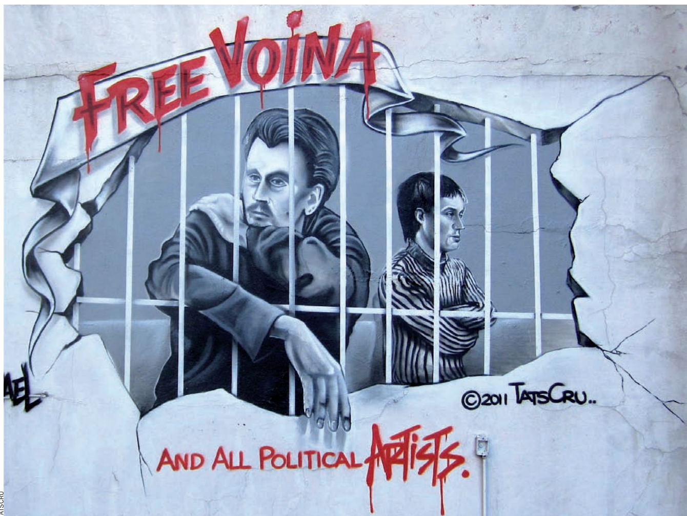
Grafit en suport de Voïna, fet pel grup d'artistes de Nova York Artists 4 Israel, en un carrer d'aquesta ciutat nord-americana.

Les accions del col·lectiu d'artistes Voïna incomoden des de fa mesos les autoritats russes. Paradoxalment, mentre dos membres del grup eren a la presó, foren nominats per al premi Innovació, creat pel Ministeri de Cultura, que es lliurarà el dia 7 d'abril.