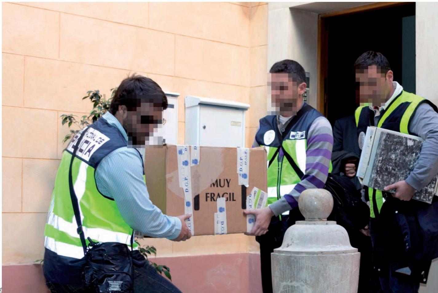
El 25 de març propassat, agents de la policia espanyola van escorcollar la seu d'Unió Mallorquina a Palma.