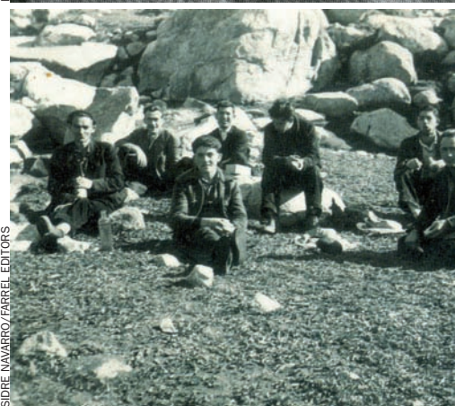
ISIDRE NAVARRO/FARELL EDITORS