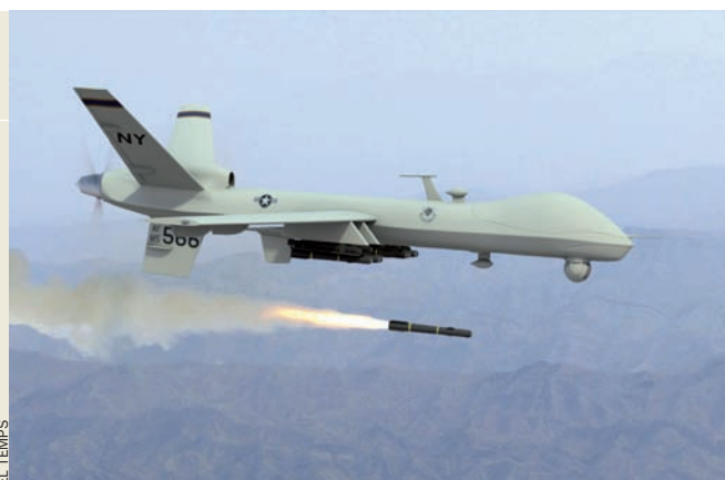
Un Predator dispara un míssil Hellfire.

El Predator, juntament amb el Reaper, més modern, són dos avions sense tripulant fabricats per l'empresa californiana General Atomics i utilitzats per la CIA en la guerra contra el terrorisme internacional. Segons que assenyala el fabricant, els Predator tenen una autonomia de vol de quaranta hores, van equipats amb un sistema de control remot per satèl·lit i porten càmeres d'infraroigs i radar. El Predator va armat amb míssils antitanc supersònics del model Hellfire II, pensats per a ser disparats des d'helicòpters, mentre que el Reaper pot llançar també bombes guiades per làser com les que porten els avions de combat F16. El 7 de març passat, General Atomics va anunciar que havia lliurat a l'exèrcit dels Estats Units el Predator que fa 268. Aquesta empresa subministra també aquests aparells a l'exèrcit italià. Segons que assenyala el diari The New York Times , el 2009 els