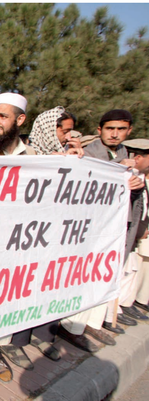
desembre de l'any passat.

D eu anys després dels atemptats terroristes que van tenir lloc als Estats Units el setembre del 2001, l'instigador, l'organització al-Qaida, travessa el pitjor moment. Una de les principals raons és que el seu lideratge ja no gaudeix de la pau, la tranquil·litat i la seguretat del refugi que li proporcionaven les remotes i desèrtiques àrees tribals del Pakistan, properes a la frontera amb l'Afganistan. Això, si més no, es desprèn d'una sèrie documental que la BBC ha emès en dos episodis