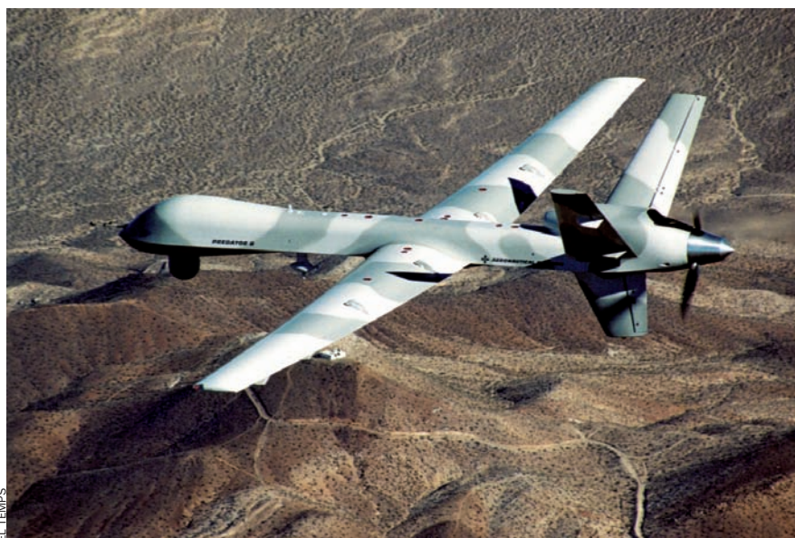
Un avió no tripulat del model Predator sobrevola una zona desèrtica de la frontera entre l'Afganistan i el Pakistan.

D eu anys després dels atemptats terroristes que van tenir lloc als Estats Units el setembre del 2001, l'instigador, l'organització al-Qaida, travessa el pitjor moment. Una de les principals raons és que el seu lideratge ja no gaudeix de la pau, la tranquil·litat i la seguretat del refugi que li proporcionaven les remotes i desèrtiques àrees tribals del Pakistan, properes a la frontera amb l'Afganistan. Això, si més no, es desprèn d'una sèrie documental que la BBC ha emès en dos episodis