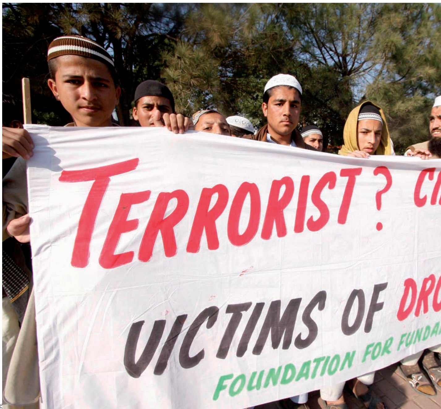
Un grup de pakistanesos de l'àrea tribal del Waziristan protestaven contra la utilització d'avions Predator davant del Parlament, a Islamabad, el