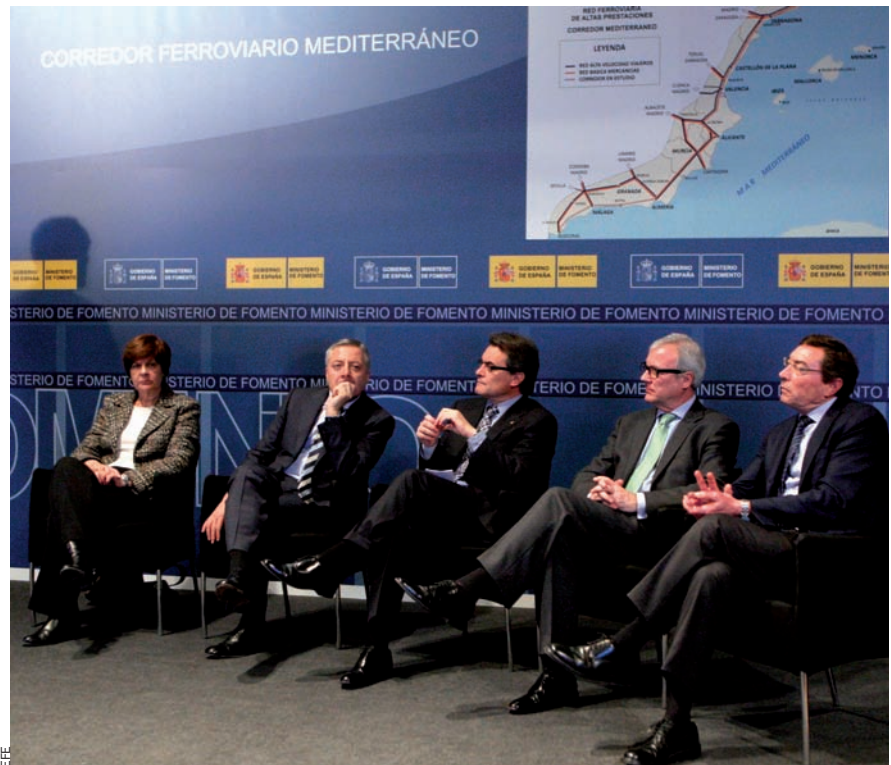
D'esquerra a dreta, la consellera d'Habitatge i Obres Públiques d'Andalusia, el ministre espanyol de Foment, el president català, el murcià i el conseller d'Infraestructures valencià.

La setmana passada el ministeri espanyol de Foment va presentar el seu estudi sobre el corredor mediterrani. El document, que preveu una doble línia segregada per a mercaderies i passatgers el 2020, és un pas endavant, segons els agents econòmics del país, per bé que lamenten la falta de concreció, tant de terminis d'execució com de finançament.