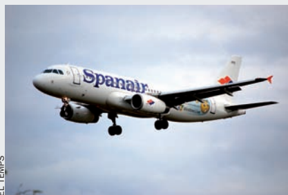
La companyia aèria catalana Spanair i Singapore Airlines enllaçaran amb São Paulo.

D’una altra banda, arran de la inauguració del nou vol a São Paulo, la