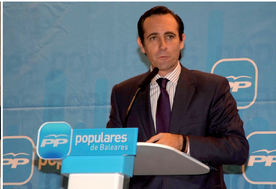
El PSIB de Francesc Antich tot sol no pot vèncer el PP de José Ramón Bauzá. El dubte no és qui guanyarà les eleccions, sinó només si el PP tindrà majoria absoluta o no.