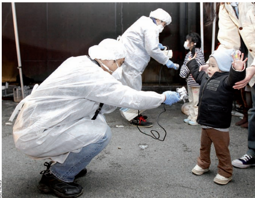
Control de radiació a la població evacuada al Japó.