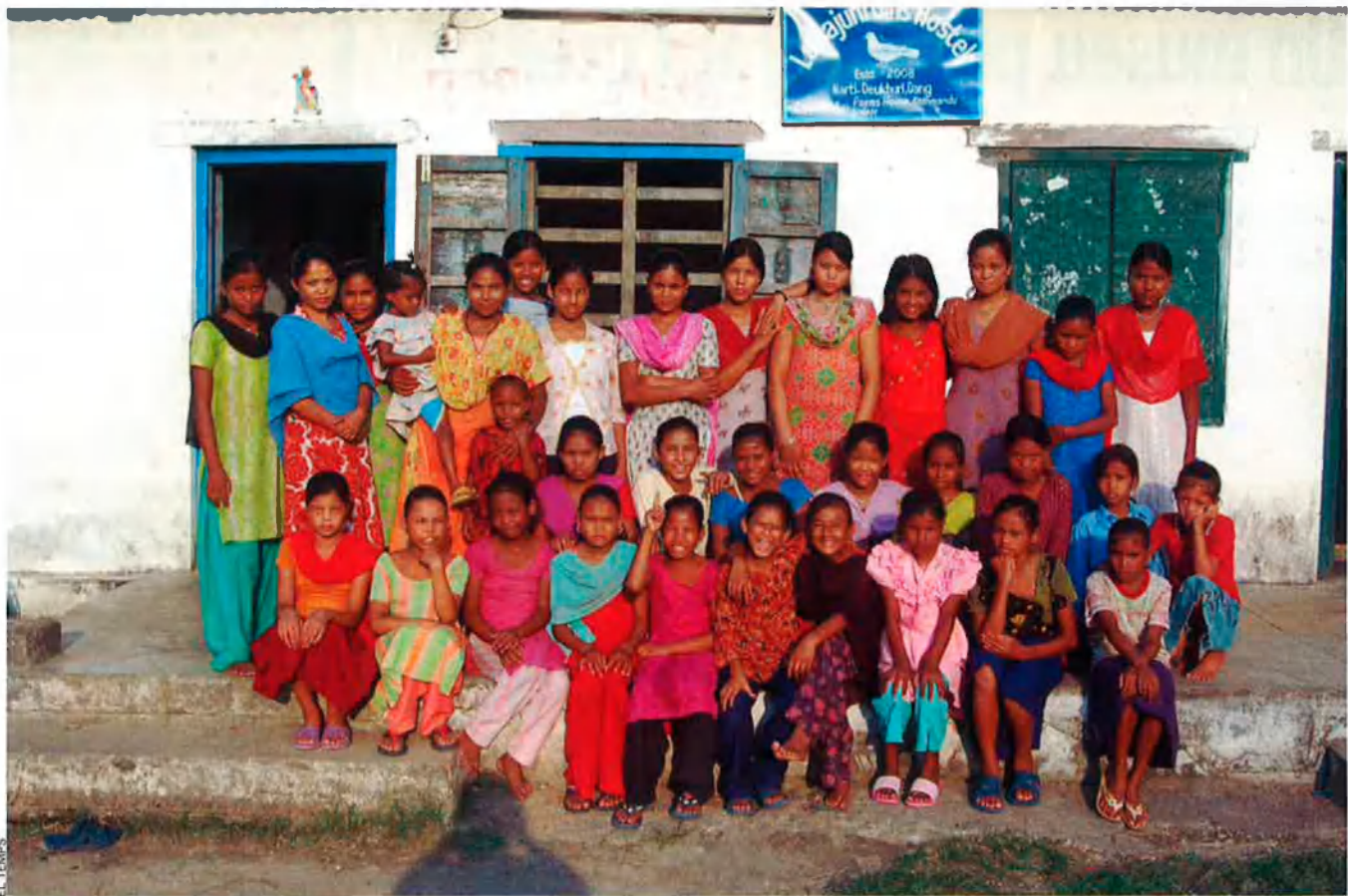
Imatge de l'alberg de Narti, al Nepal, que forma part del Projecte d'Abolició Kamalari per a la supressió del sistema d'esclavitud.