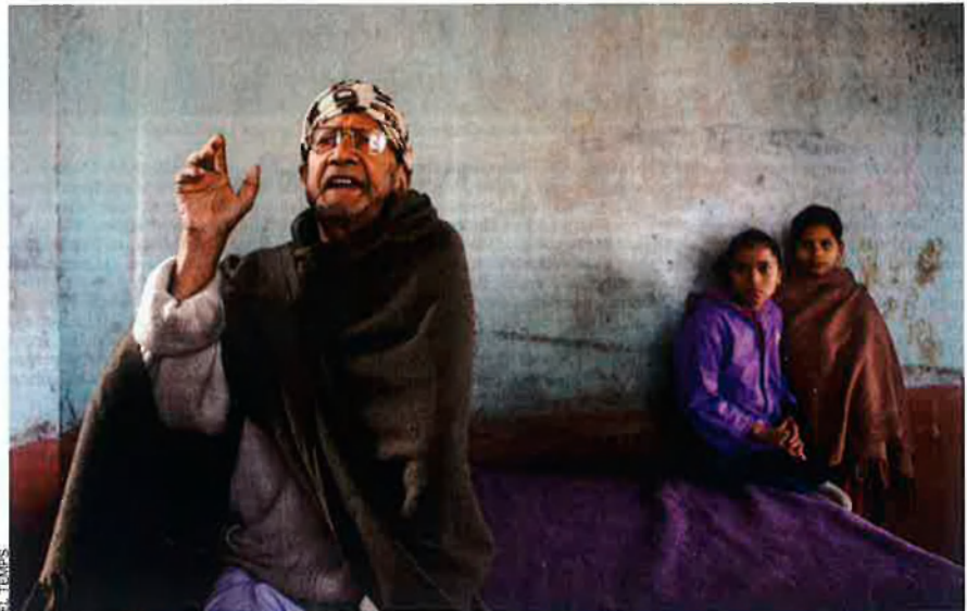
Dangi, negrer, al poble prop de Lamahi: "Dec haver tingut cinquanta xiquetes al llarg de la meua vida."

Segons les estimacions de les organitzacions humanitàries, al Nepal hi ha 10.000 xiquetes que han de treballar com a kamalari . L'any 1956, l'ONU ja va qualificar d'esclavitud qualsevol forma de treball infantil i servitud per