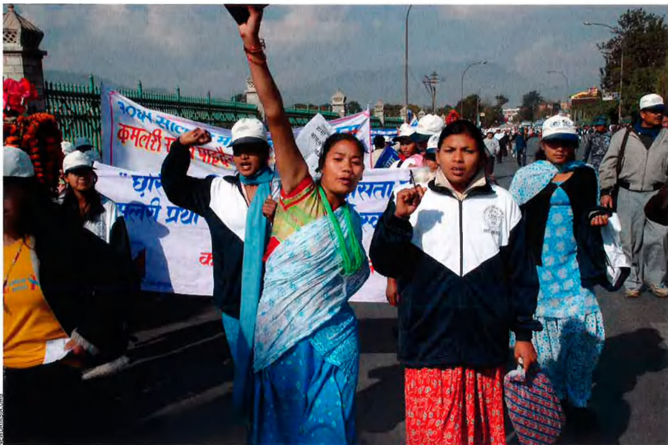
Marxa d'ex-esclaves per a demanar l'alliberament de les kamalari, l'octubre del 2009.

ja no havien de treballar els camps dels terratinents, però d'aquesta manera també els faltaven els mitjans de subsistència. Sense camps, ja no hi havia arròs. D'aleshores ençà, les filles que venen a la festa maghi són sovint l'única font d'ingressos segura. Poden guanyar entre 4.000 i 5.000 rupies per xiqueta cada any, si tot va bé. Si no va bé, només es paga una vegada i la xiqueta simplement desapareix en una altra ciutat.