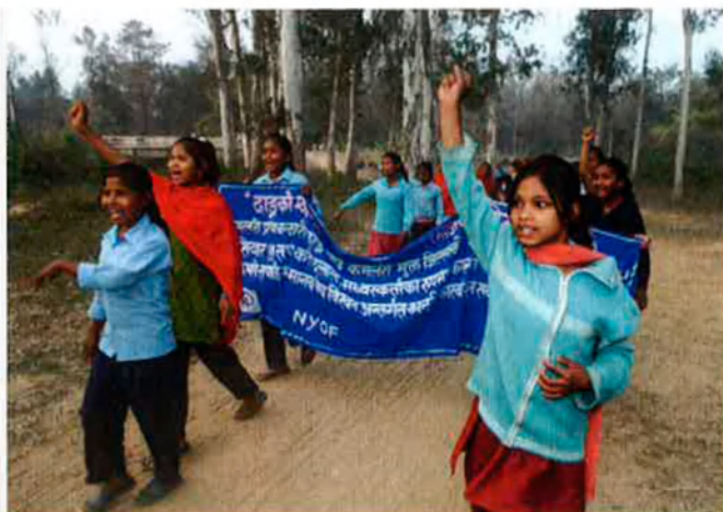
Rami, alliberada, a Lamahl. Ex-esclaves a Dhangadhi. Les més menudes tenen quatre anys. Fan manifestacions, tracten amb els terratinents i amb els pares.

endeutament, i ho va prohibir. Malgrat que oficialment ja fa temps que el tràfic de persones es va abolir a tot el món, encara n'hi continua havent en una mesura considerable en uns setanta països. Al món hi ha 27 milions de víctimes de l'esclavitud moderna: viuen en servitud, com a víctimes de prostitució forçosa i com a serfs. Entre un 40% i 50% són nens, molts d'ells a Àsia.