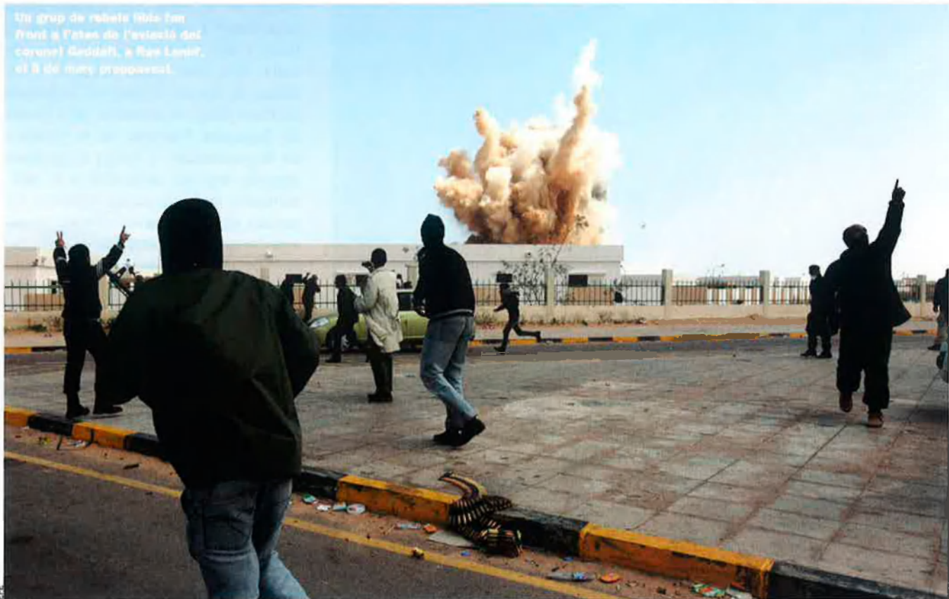
Un grup de rebels líbia (en front a l'atac de l'estació del coronel Gaddafi, a Ras Lanuf, el 8 de març passat).