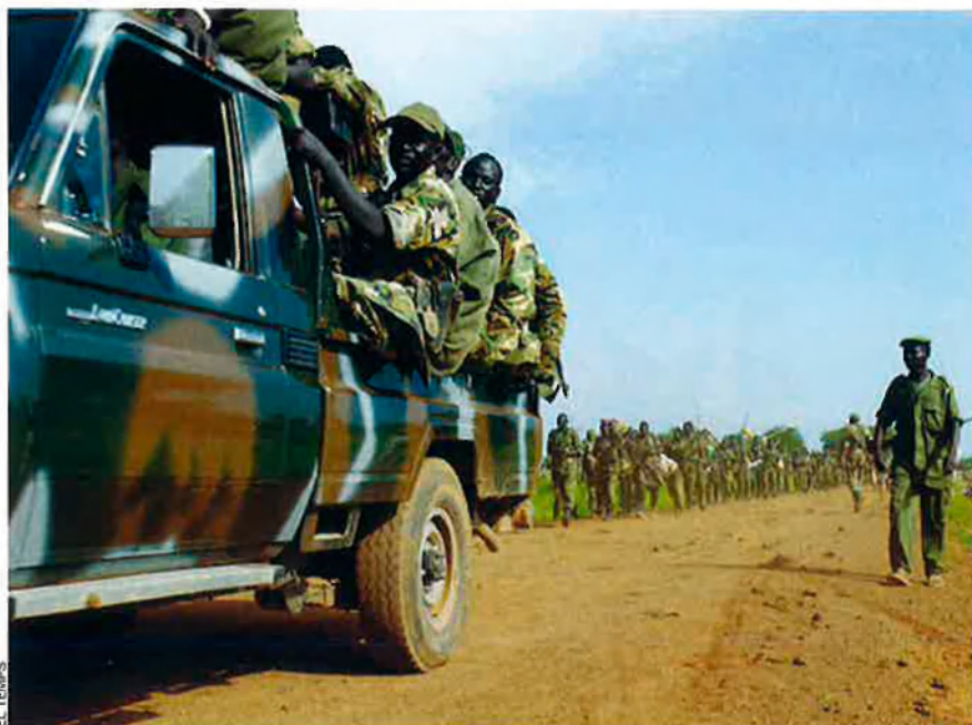
Les milícies rebels del Sudan del Sud han tornat a desfermar episodis de violència aquests darrers dies, tal com passava durant la guerra civil que hi va tenir lloc del 1993 al 2005.