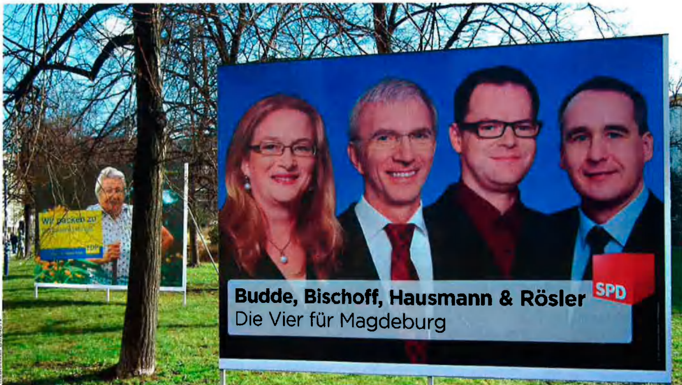
L'estat alemany de Saxònia-Anhalt farà eleccions legislatives el dia dia 20 de març.

De ser aquest el cas. Qualsevol lectura desapaixonada dels resultats quedaria implacablement eclipsada per la controvèrsia entorn del més famós aristòcrata del país. Amb Guttenberg o sense, les eleccions poden trasbalsar l'organigrama tradicional de repartiment de papers entre els grans –la Unió Cristianodemòcrata (CDU) de Merkel i el Partit Socialdemòcrata (SPD– i els petits –Verds, liberals i Esquerra. Els Verds van a totes a Baden-Württemberg, perquè en cas d'afebliment conservador poden ser la clau del relleu de poder en aquest feu etern de la CDU. L'Esquerra vol estripar les cartes a Saxònia-Anhalt, ara dominada per una gran coalició que trontolla i on aquesta formació d'arrels postcomunistes és la segona força, després de la CDU. Un govern dominat per l'Esquerra a Saxònia-Anhalt, aquesta setmana, combinat amb victòria del SPD a Renània-Palatinat i derrota de la CDU a Baden-Württemberg, a la següent, seria un malson per a Merkel, sense roda de recanvi imminent, des de l'escàndol del baró mentider que, per mediàtic que sigui, no pot ressuscitar políticament sense passar una temporadeta al purgatori.