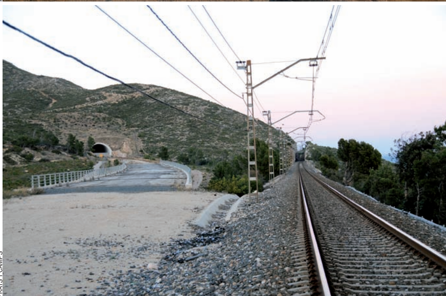
A sota, el punt –a Vandellòs– on hi ha la via única i on es construeix una nova plataforma per a la doble via. A dalt, la mateixa plataforma, 43 quilòmetres més al nord, al terme de Perafort.