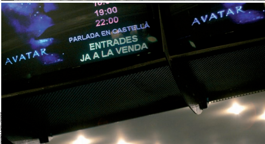
Dalt, una dona immigrant, en una plaça. Sobre aquestes línies, la cartellera d'una sala de cinema de Barcelona. La llei d'acollida i la llei del cinema han estat objecte de recurs pel fet de potenciar l'ús del català. La prohibició de les curses de braus a Catalunya també espera sentència al Constitucional.