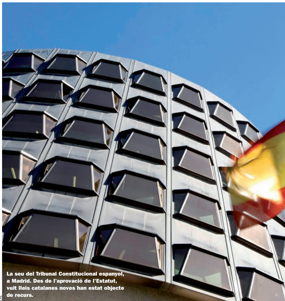
La seu del Tribunal Constitucional espanyol, a Madrid. Des de l'aprovació de l'Estatut, vuit lleis catalanes noves han estat objecte de recurs.

Des que es va aprovar l'Estatut de Catalunya, vuit lleis catalanes han anat a espetegar al Constitucional espanyol. S'afegeixen a una llista que ja supera la quinzena. Lleis com la de d'acollida dels immigrants, la de consultes, el codi de consum, la d'educació, la del cinema o la de prohibició de les curses de braus allarguen una llista que fa palesa una conflictivitat creixent entre Catalunya i l'estat espanyol.