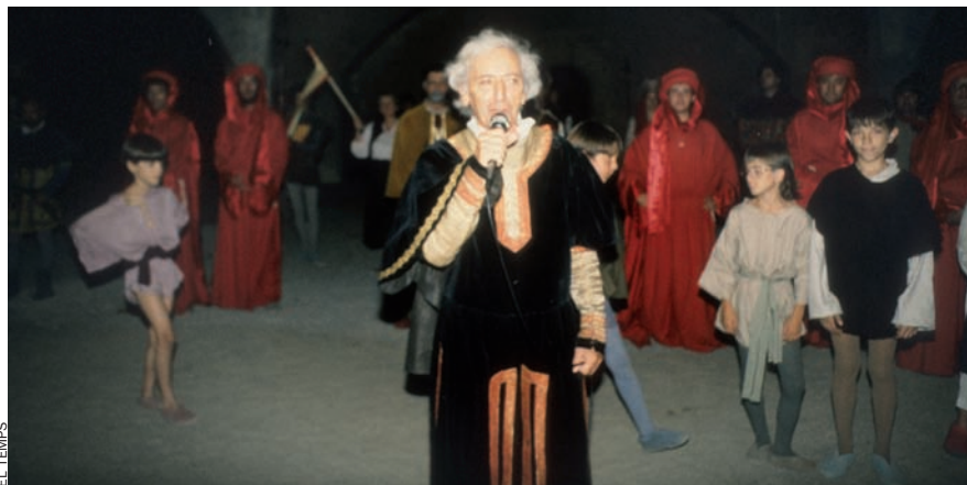
Jordi Barre (1920-2011) es va mostrar actiu fins els darrers dies.

La veu catalana més escoltada de Catalunya Nord es va apagar el 16 de febrer al petit poble de Pontellà. Jordi Barre deixa una vintena de discos i més de 250 cançons.