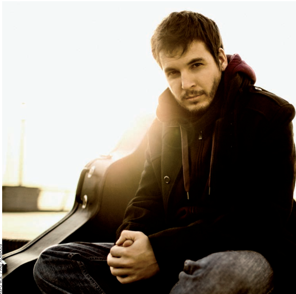
XERO I.M.S. / PAU ALABAJOS

—És una altra de les grans polèmiques. Una cançó no s'acaba mai, s'abandona. Si la continues perfeccionant i perfeccionant i perfeccionant i donant-hi tantes visions com vulgues... és inacabable. Hi ha mil milions de