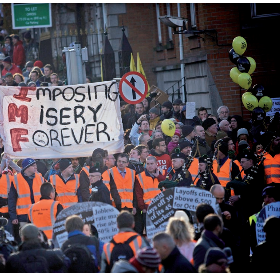
del govern d'acceptar el pla de rescat de l'FMI i la UE, a Dublín, a final de novembre del 2010.

palment a l'oficina central de Correus, la GPO. Aquells fets van donar peu a una embranzida del republicanisme irlandès que, pocs anys després, convertí el país en un estat lliure. D'aquí ve que l'editorial de l' Irish Times , que tocava la fibra sensible, tingués una gran repercussió. A grans trets, el diari criticava el govern per haver regalat a la Unió Europea i al Banc Central Europeu la sobirania que tant havia costat d'aconseguir de l'imperi Britànic. “La ignominiosa veritat d'aquesta situació és que aquesta vegada no ens han pres la sobirania, sinó que l'hem malmenada nosaltres mateixos”, es queixava The Irish Times , que en culpava el govern del Fianna Fáil.