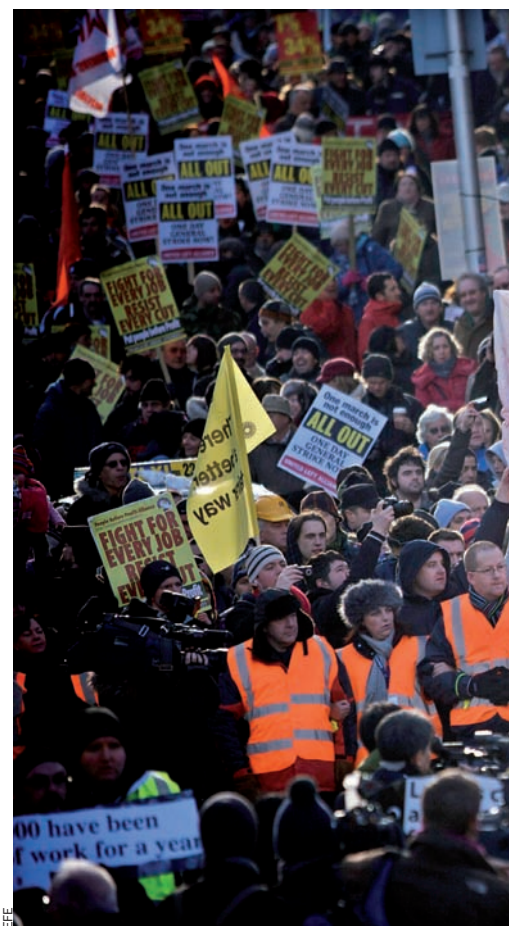
Imatge d'una manifestació contra la decisió

La caiguda en la intenció de vot del Fianna Fáil té una motivació clara. Segons que assenyalava el diari The Belfast Telegraph el dia 1 de febrer, una gran part de l'electorat culpa el partit del primer ministre de la recessió i de la crisi que ha portat el govern a haver d'acceptar el rescat de l'FMI i de la UE. A més, segons aquest diari, la majoria dels irlandesos veuen vincles entre aquest partit i l'anomenat cercle daurat que conformen les constructores, les immobiliàries i els bancs. En aquest