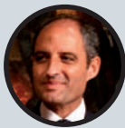
Francisco Camps President de la Generalitat Valenciana des del 21 de juny del 2003