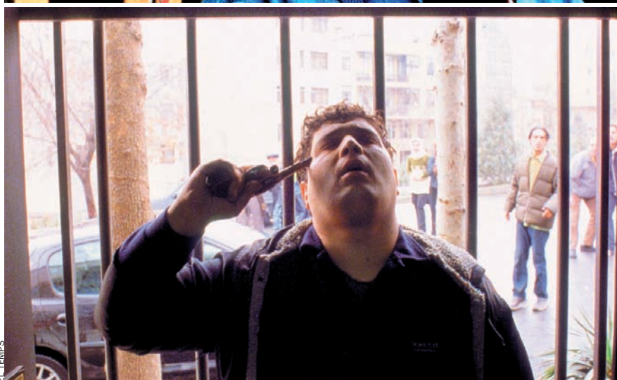
Imatges de tres films de Jafar Panahi: a dalt, Dayereh ('El cercle', 2000) i Crimson Gold (2003). A sota, una imatge d' Offside (2006).