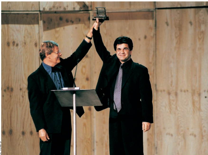
Jafar Panahi rep el premi Fipresci al millor film de l'any per Dayereh ('El cercle') al Festival de Sant Sebastià, l'any 2001.

La capacitat de Panahi de desenvolupar un panorama social en pocs metres quadrats és també una de les pors del règim de Teheran. Probablement per això les autoritats van enviar els seus titelles a l’apartament del director per a detenir-lo, tant a ell com el seu equip.