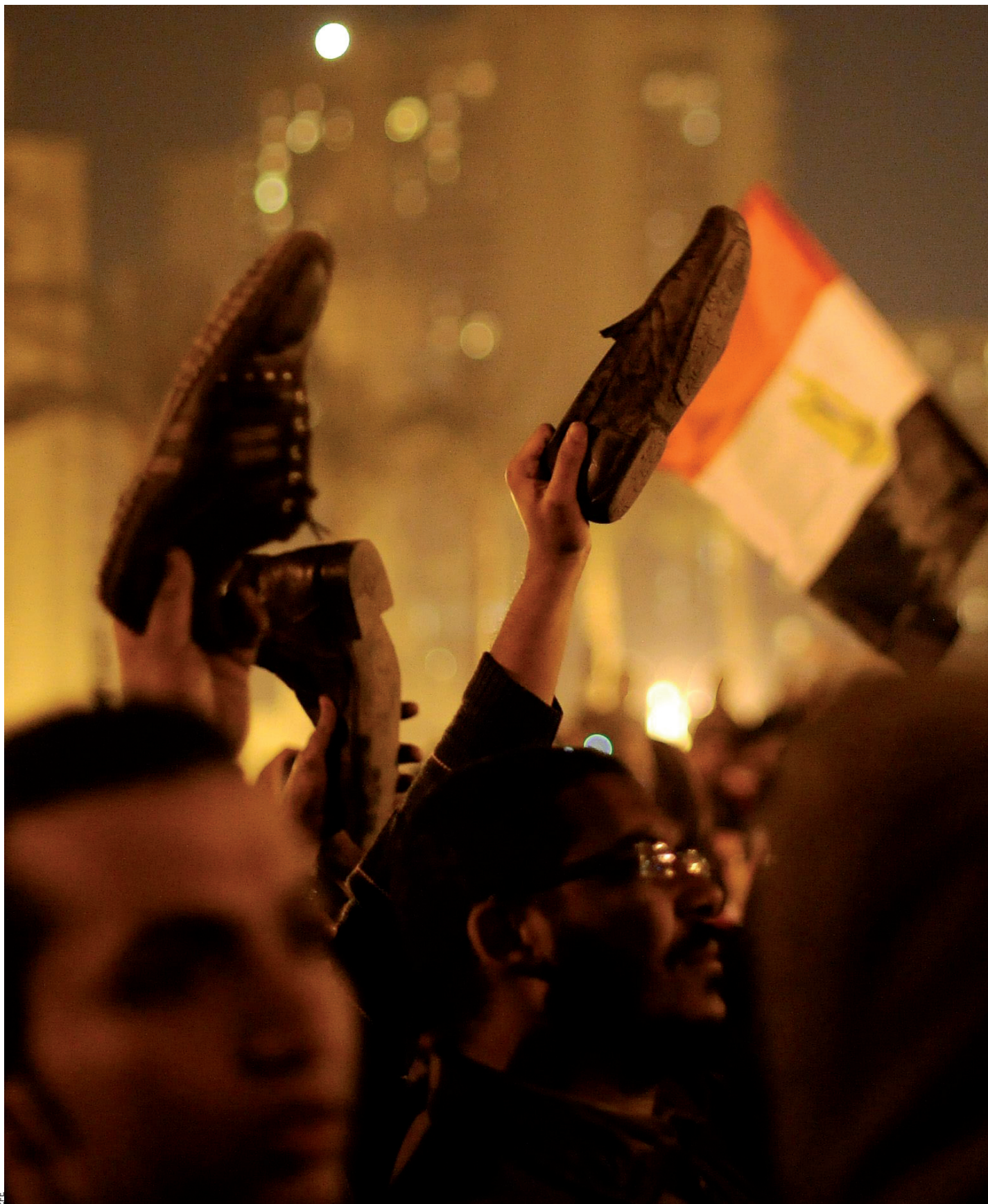
Els manifestants egípcis aixecaven les sabates enlaire –una acció molt simbòlica dins la cultura àrab–, el dia 1 de febrer proppassat, a la plaça