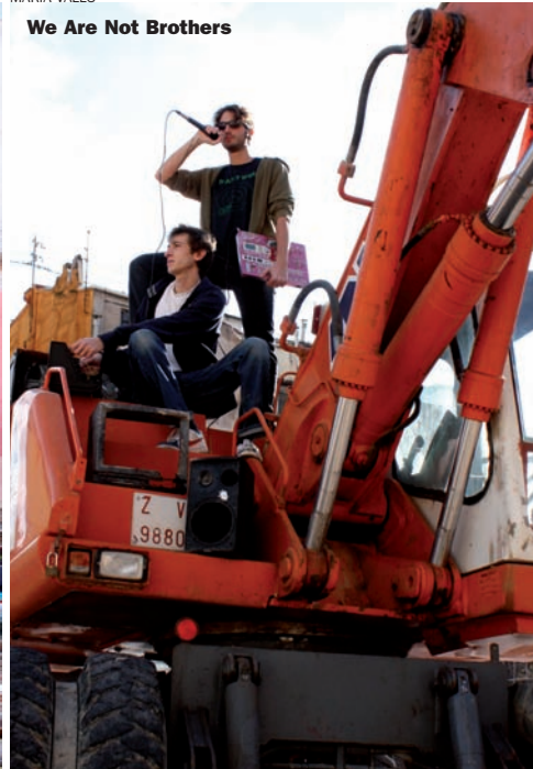
We Are Not Brothers