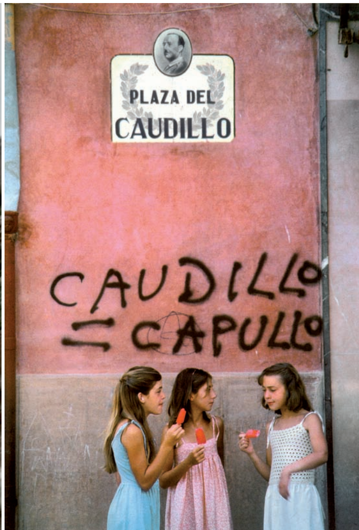
censurada a la Universitat Politècnica de València.

enllà i s'emporti amb ell la possibilitat d'un negatiu que farà història. "Hi ha gent que m'ha demanat si eren tropes nazis. Semblava una ciutat presa per la Gestapo, però és València, a la processó del Corpus. Aquella foto va ser una punyetera casualitat. Veig aquell home, faig la foto i després trobe que tot ha eixit així. I descobreixc la xiqueta, també, que sembla que plora."