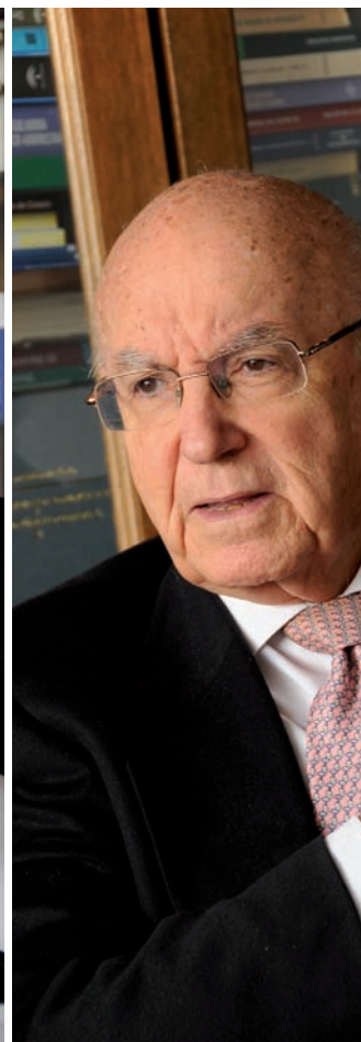
“L'article 151, que era la possibilitat d'equiparar-se a les comunitats històriques, el vaig pactar,

l'autonomia, pensava que n'havien de tenir tots.