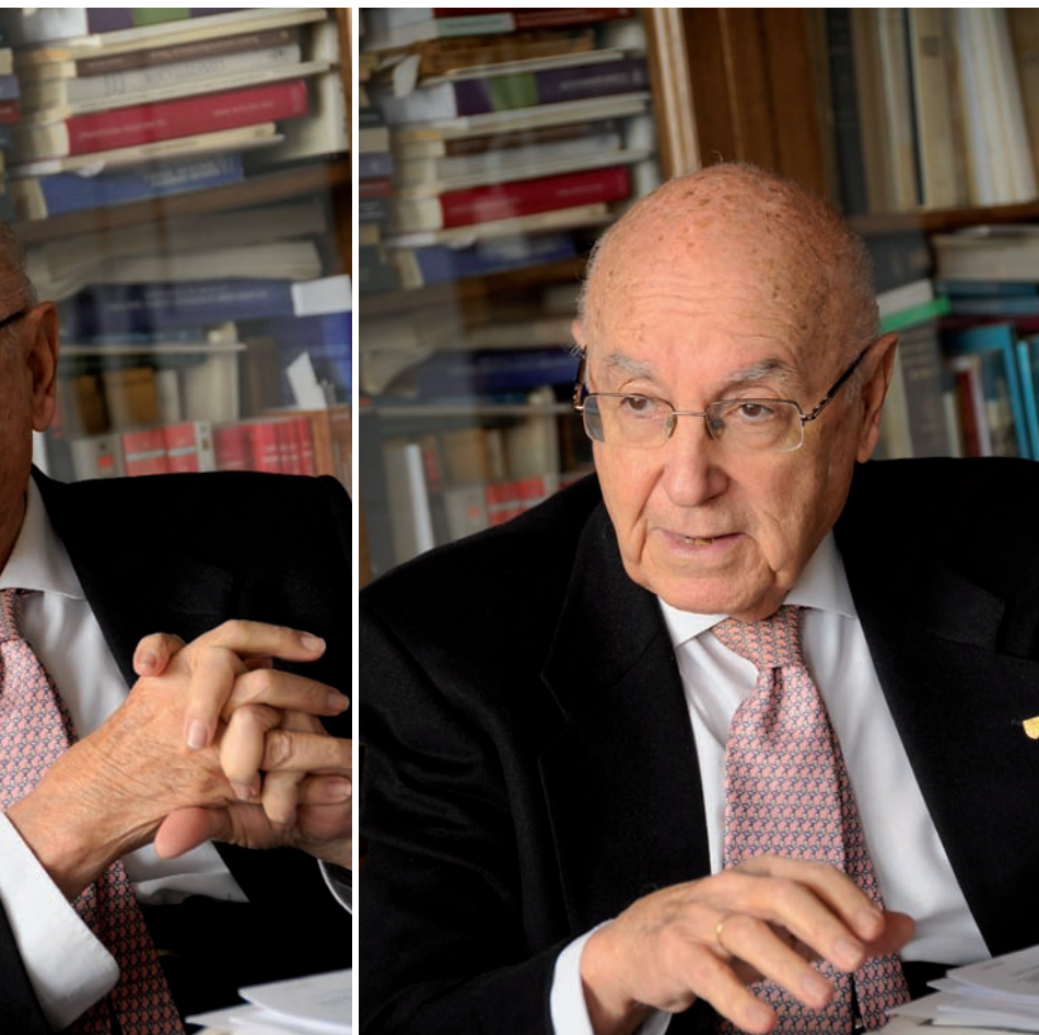
primer amb Suárez i després amb els pares de la Constitució*