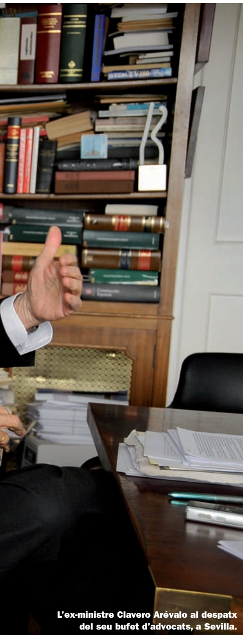
L'ex-ministre Clavero Arévalo al despatx del seu bufet d'advocats, a Sevilla.

E l 1977 éreu diputat a les Corts constituents i ministre adjunt per a les Regions al govern d'Adolfo Suárez (UCD). Vau aconseguir que la Constitució inclogués la possibilitat de crear més comunitats autònomes, a banda de Catalunya, Galícia i el País Basc. Per què?