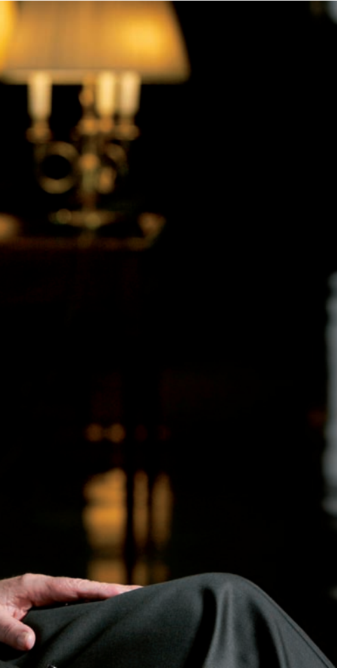
eleccions d'una manera molt clara"

que mesurarem quin pes té això que la premsa anomena sector catalanista .