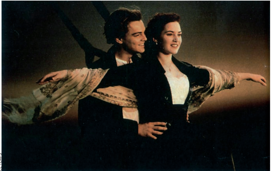
Les estrelles de Titanic , Leonardo Di Caprio, Kate Winslet, el 1997. Cameron parla de "la mateixa intensitat que en els somnis reals". A sota, James Cameron.

—Malgrat tot, el conte de poble primitiu que es defensa dels inva-