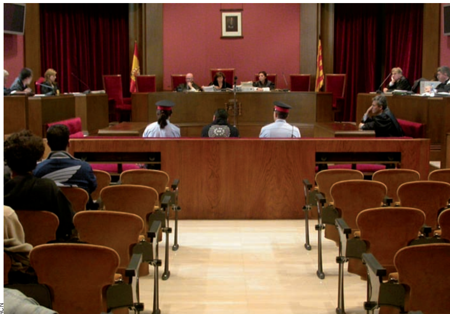
Els advocats d'ofici no cobren els honoraris des de fa tres mesos. D'endarreriments, però, n'hi ha des de fa més d'un any, quan la Generalitat va començar a fragmentar pagaments.

de l'administració pública en 40.650 milions d'euros, prop del 16% del PIB català, que inclouen l'últim objectiu de dèficit pressupostari del govern per al 2010: 4.700 milions d'euros, el 2,41% del PIB. Amb tot, el president de la Generalitat, Artur Mas, ja ha avançat que no creu que es compleixi la previsió, que segons les primeres xifres no oficials amb què treballa el nou executiu arribaria a 7.000 milions, el 3,6% del PIB. A la caixa, el govern anterior govern hi deixa 1.987 milions d'euros, de manera que les necessitats d'endeutament previstes serien de 6.801 milions d'euros segons aquest informe.