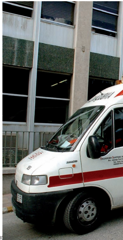
La Generalitat té al calaix factures pendents

es troba abocada l'administració catalana correspon a la partida sanitària. El nou conseller d'Economia, Andreu Mas-Colell, ho deixava molt clar: “el forat dels comptes públics s'explica, sobretot, pel cost que té la sanitat pública. El component bàsic de l'excés de