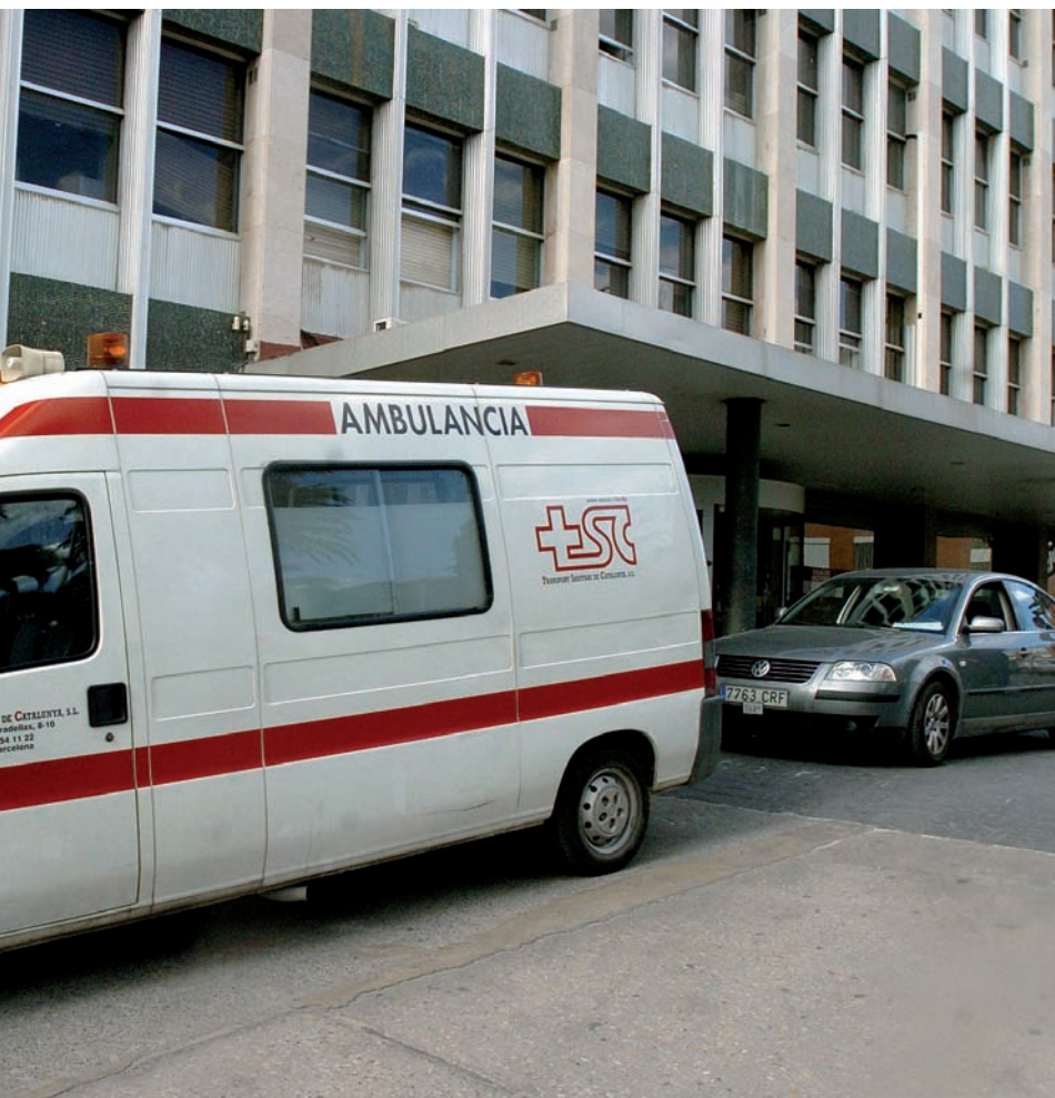
de pagar per valor d'uns 400 milions d'euros als hospitals que fan serveis concertats per al SCS.