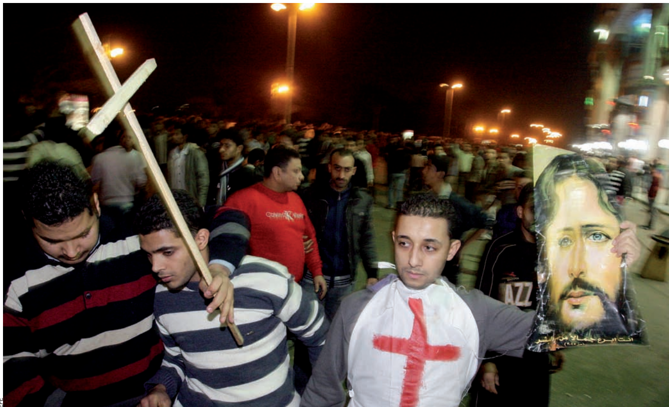
Un grup de cristians egipcis es manifesten al Caire, el diumenge 2 de gener, per a protestar contra l'atemptat de què va ser víctima aquesta comunitat.