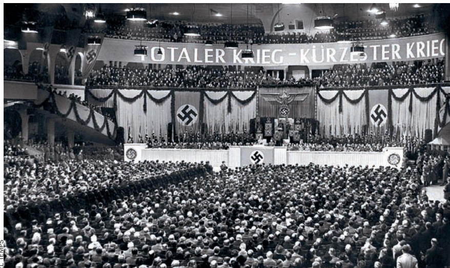
L'orador Goebbels al Palau dels Esports de Berlín, 1943. La "Mobilització moral total".

Goebbels, després d'obtenir una qualificació mitjana al seu doctorat ( rite superato , un bon "suficient") sobre Wilhelm von Schütz, un escriptor romàntic desconegut, vol ser periodista; fins i tot, el que més li agradaria seria ser un escriptor important. Ha escrit la seua primera novel·la, Michael Vorroman , una obra molt autobiogràfica. S'imagina com una mena de Theodor Wolff. Wolff, redactor en cap del diari berlinès Berliner Tageblatt i possible-