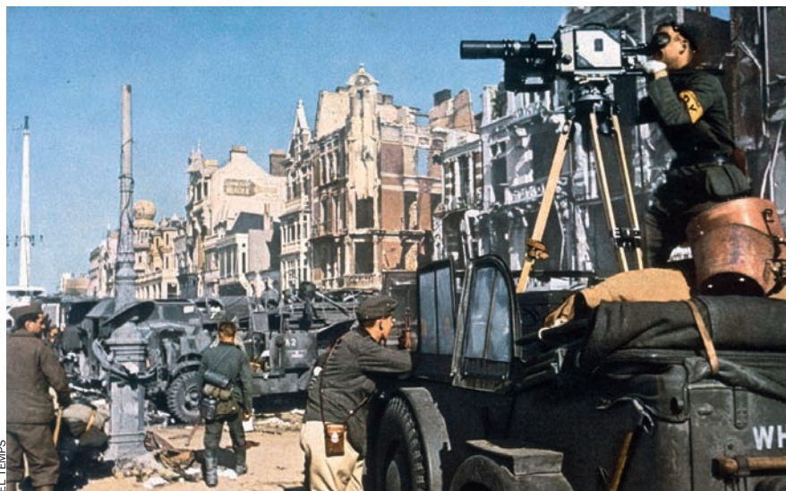
Soldats alemanys fent gravacions al front de l'oest a Dünkirchen, 1940. Sempre arribaven notícies noves sobre les victòries de la Blitzkrieg (“guerra llampec”).

Ben aviat controla tota la cultura —i la indústria dels mitjans de l’Alemanya nazi, dues mil persones treballen per a ell— i, això no obstant, sovint no juga el paper que ell mateix s’atribueix. El fùhrer el deixa participar molt poc en