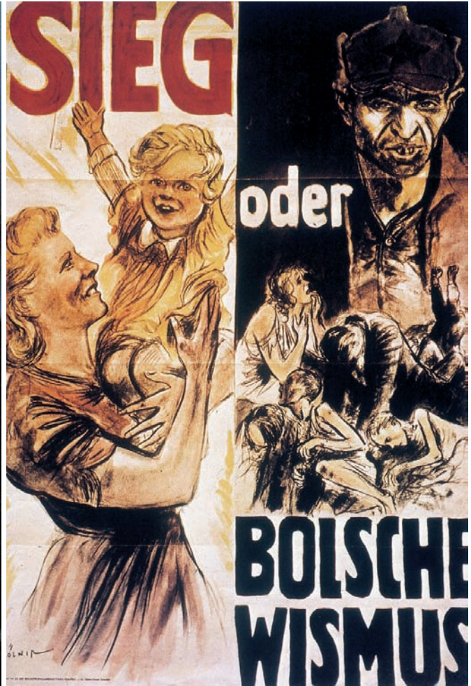
Cartell nacionalsocialista del 1943.

Aquest foc nodrit d'una persona, a part de la denigració personal, també té motius ideològics contundents: la caricatura d'“Isidor Weiss” vol denunciar la presumpta supremacia “dels jueus” al “sistema de la República de Weimar”.