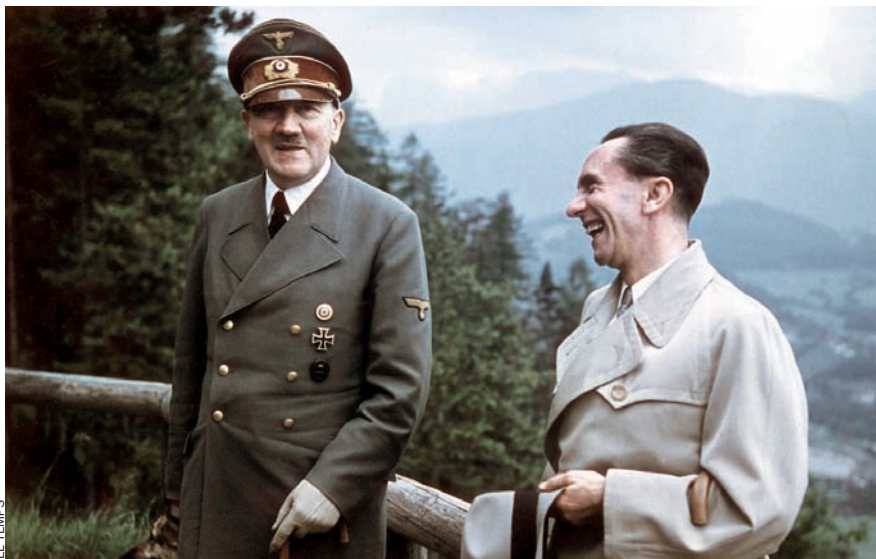
El senyor de la guerra Hitler i el ministre Goebbels, a Obersalzberg, el 1943. El lema del propagandista era "mentir per quelcom més gran".

Poc temps després de declarar l'atemptat al diplomàtic alemany arriben les intrusions i els disturbis, la premsa nazi agita els ànims.