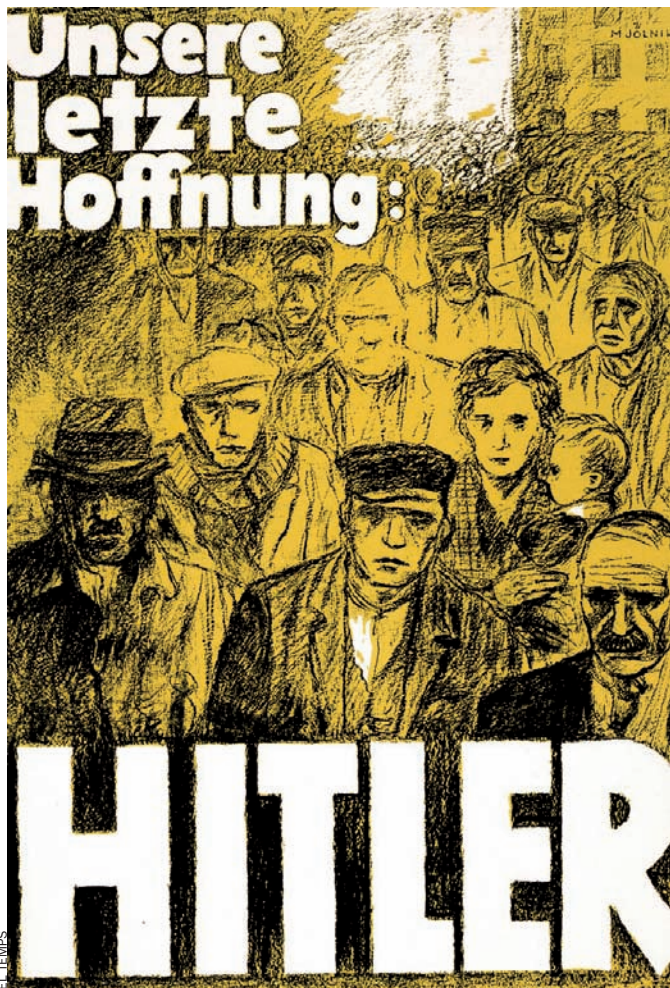
Propaganda nacionalsocialista del 1932.