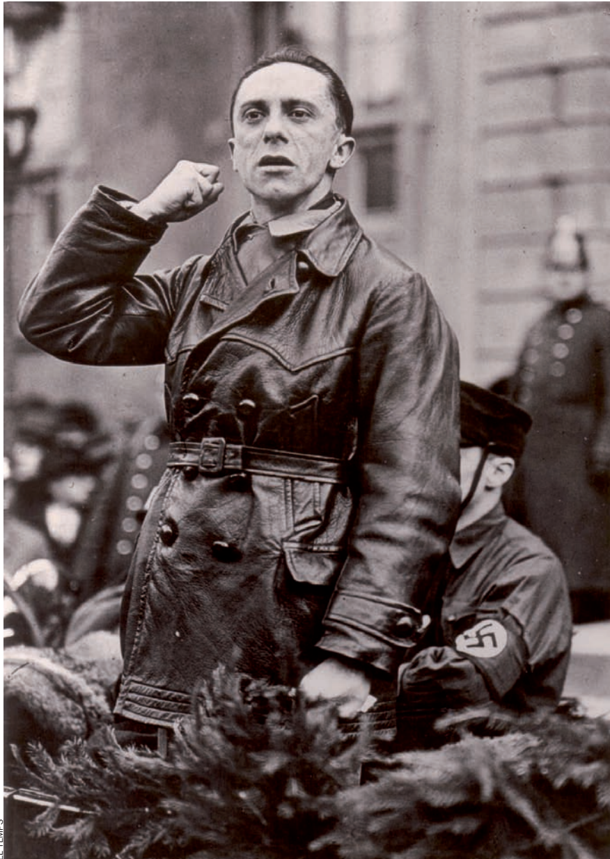
Joseph Goebbels dominava la gesticulació. “Els discursos tenien efecte en els observadors contemporanis del sud per la vivacitat i el dramatisme”, segons el biògraf Longerich.

“tornar a escoltar paraules per al cor”. L’elogiava com un “timoner en la necessitat”, “líder de la llibertat”.