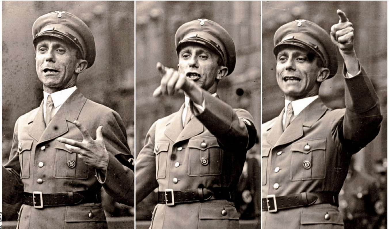
El demagog Goebbels al Lustgarten ("jardí de l'oci") a Berlín, 1934.

que cal acabar amb els "ganduls parasitaris" i amb les "activitats impúdiques de les estudiants plutocràtiques". Significa que tots els civils disponibles s'han de convertir en soldats, no importa com.