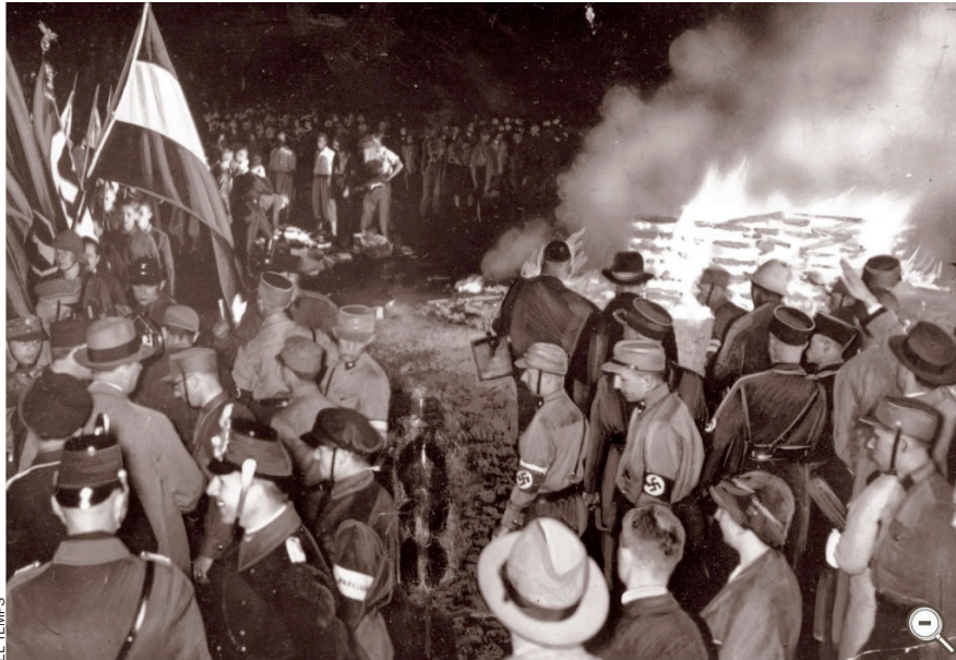
Crema de llibres a la plaça de l'Òpera de Berlín, el 1933. A Berlín s'encengueren 20.000 fogueres. L'ofensiva de Goebbels també va afectar les emissions de ràdio estrangeres.