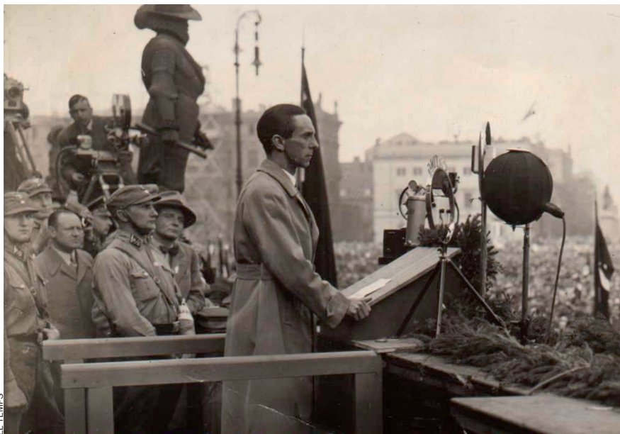
Goebbels destacava com orador. Planificava tots els seus gestos, les seves paraules, els seus silencis. També en el contacte amb la gent.

A ell allò que li importa és la superació de la lluita de classes, no el domini d'una classe, un home nou ha de nàixer en un món nou. "El 90 per cent" de la humanitat són "canalles, el 10 per cent més o menys bones persones. Per tant, aquest 10 per cent ha de governar sobre el 90 per cent restant, perquè l'estat pugui existir. Aquest és el secret de la dictadura."