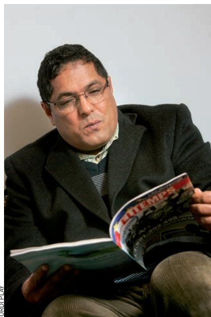
El delegat del Front Polisario repassa el reportatge sobre la venda del Sàhara publicat a EL TEMPS.

—Sempre hem demanat més implicació a Espanya com a estat i com a govern, perquè Espanya és la responsable política del drama saharià, independentment de les relacions històriques que hi puguin existir i de la solidaritat dels ciutadans espanyols amb el poble saharià. Espanya té una responsabilitat política molt seriosa;