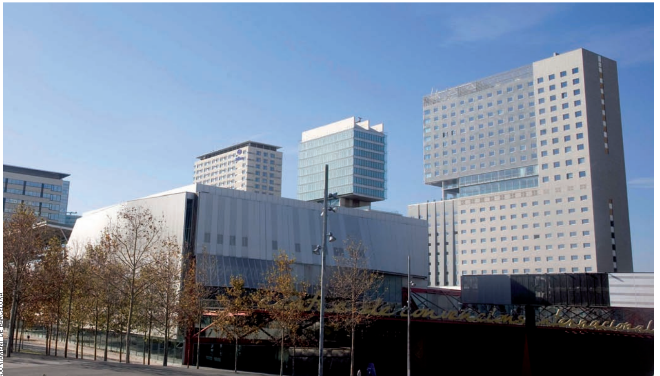
La Universitat Pompeu Fabra, situada al Poble Nou, un dels símbols del 22@Barcelona.