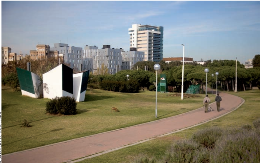
El parc del Poblenou, un dels espais lliures d'ús públic del 22@Barcelona.

Creixement demogràfic. D'una altra banda, les millores executades al barri del Poblenou han atret un gran nombre de nous residents, cosa que es constata en les xifres sobre població. El nombre d'habitants al districte del 22@Barcelona ha crescut d'un 22,8% aquests darrers deu anys: s'ha passat dels 73.400 veïns registrats l'any 2001 als més de 90.000 actuals. L'augment de la població del barri del Poblenou supera de molt el de la ciutat de Barcelona, que en aquest mateix període ha estat del 8% i, fins i tot, la població del total de Catalunya, que entre els anys 2001 i 2009 ha crescut d'un 17,9%. En aquest sentit, el model del 22@Barcelona ha volgut afavorir la cohesió social i fomentar un desenvolupament econòmic més equilibrat i sostenible. Es tracta, de fet, d'una renovació urbana adaptada a les noves necessitats de grans ciutats com Barcelona; un model que, fet i fet, és de referència en la transformació urbanística i social de grans ciutats d'arreu del món, com ara Rio de Janeiro, Boston, Istanbul o Ciutat del Cap.