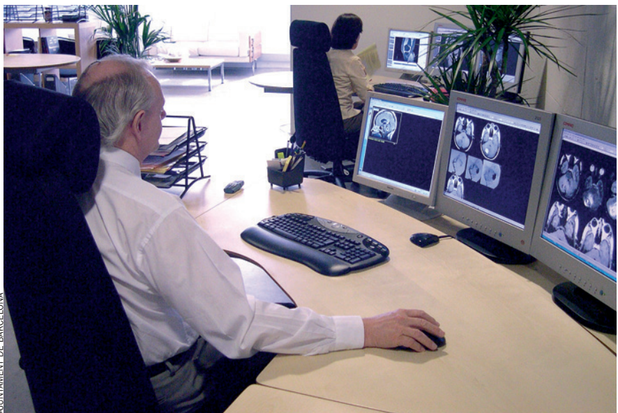
El 27% de les empreses del 22@ es dediquen a activitats intenses en coneixement.