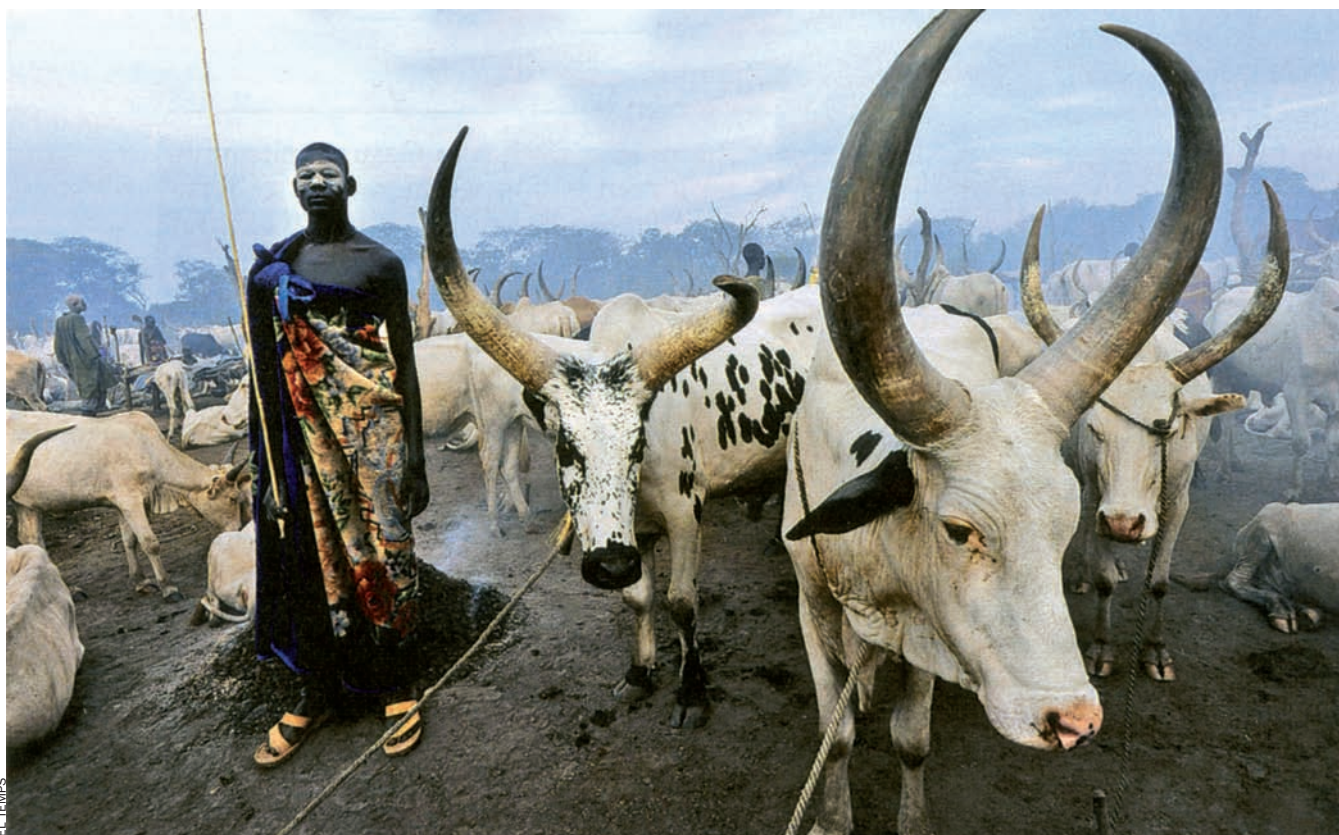
El bestiar és vital per a les poblacions del sud del Sudan. També a Abuyong, un dels últims redutes del cuc de Guinea.

Milers de larves. Quan el cuc barrina per sortir de la pell, el pacient nota una sensació de cremor insuportable. L'aigua alleuja el dolor, per això els infestats fiquen els peus als estanys. El problema és que el cuc, en contacte amb l'aigua, hi deixa anar milers de larves. Els copèpodes es mengen les larves i quan les persones beuen l'aigua es completa el cicle. Un cop a l'interior del cos, el cuc passa per l'intestí prim, i d'allí al teixit, on creix durant un any, si fa no fa, fins que torna a sortir a través de la pell i recomença el cicle.