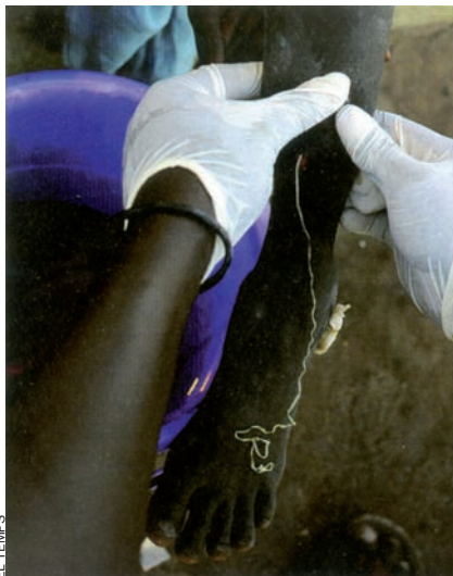
Les larves del cuc de Guinea es troben a l'aigua i també en els crustacis que hi viuen.

El 1995, Carter fins i tot va negociar una alto-el-foc al Sudan, a fi que els seus delegats en la lluita contra el