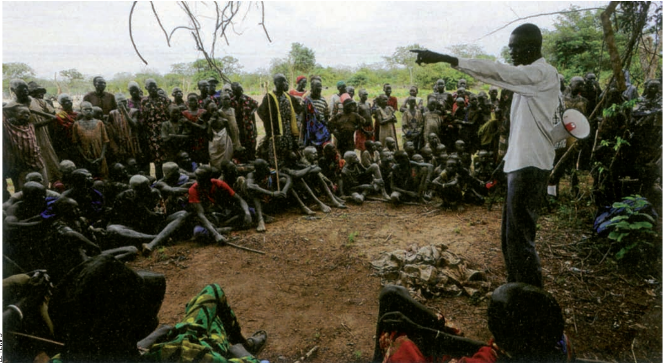
Un sanitari recorda als sudanesos que l'ús de filtres per a l'aigua estalvia el contagi del cuc de Guinea.

Tres cucs despunten de les ferides obertes que té a les cames. Un altre cuc acaba de treure el cap al peu esquerre de l'Ajak.