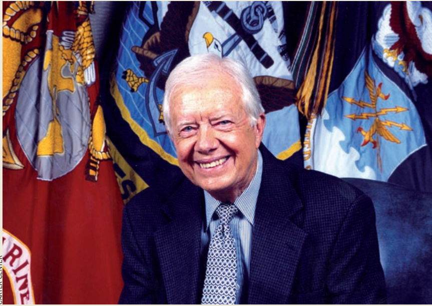
Jimmy Carter considera que "la victòria sobre els cucs dóna autoestima als sudanesos".

—Què significaria per a vós personalment si el Centre Carter reissuera a eradicar realment la malaltia dels cucs de Guinea?